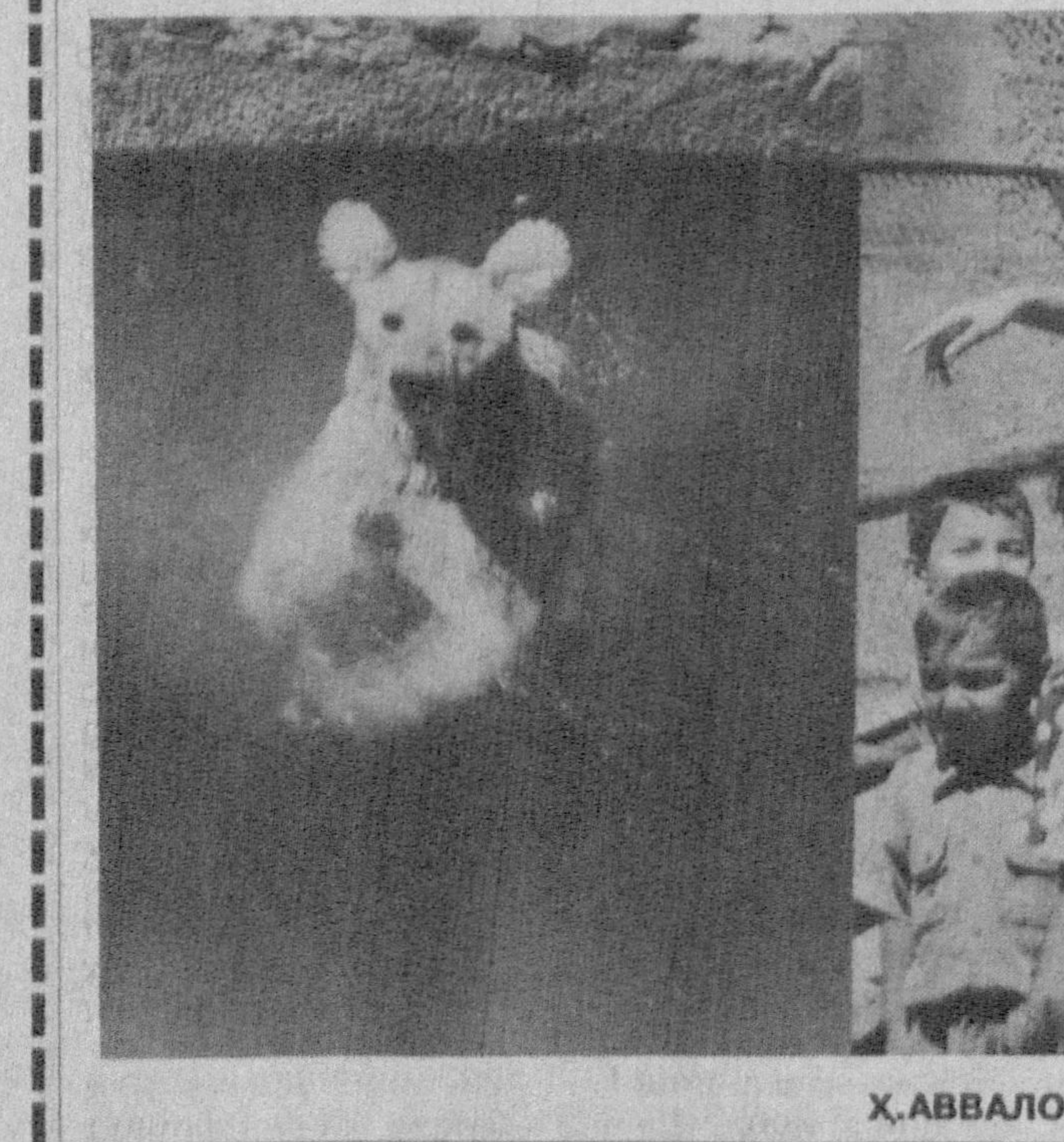
Х.АВВАЛОВ олган суратлар

Ез гаини АНВОЙИ ГУЛЛАР УФУРГАН ЖОЙДА оромгоҳ фаолият кўрсатиб, 1500 дан ортиқ қишлоқ ҳўжалик ходимлари ва деҳқонларнинг фарзандлари оромгоҳда хордик чиқаришди. Иш режамизда ўқувчиларни кўпроқ она-Ватанимизнинг тарихий жойларини зиёрат қилишни, қўшни оромгоҳ жамоалари билан спорт мусобақалари ўтказишни режалаштирганмиз. Болалар Яккабоғ, Шаҳрисабз шаҳарларидаги Мадраса, Амир Темур туғилган Хўжаилфор қишлоғи, маданий