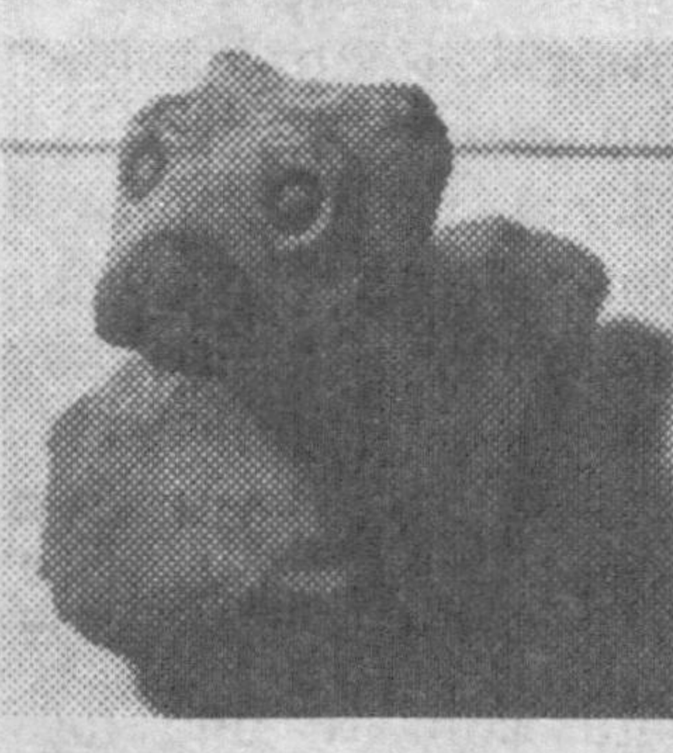
учала шаҳардан турли асрларда зарб этилган тангалар, сополсозлик буюмлари топилиди.

Ўзбекистон ҳудудида кўплаб тарихий обидалар, кўҳна маданиятимиз сир-асрорлари яшириниб ётибди. Уларни очиб, ўрганиш ва илмий асослаш масалалари билан олимлар, мутахассислар бир неча йиллардан буён шуғулланиб келмоқдалар. Чотқол тизма тоғларига туташ ерларда жойлашган Чорлоқ ота, Намданак (Эскитепа), Кўтулли ота (Тошкент вилояти) деб аталмиш гўша асрларда гуллаб-яшнаган, обод ва сувга сероб таниқли шаҳарчалар ҳисобланган. Улар ёнидан оқиб ўтган Бошқизилсой ариғи кўп асрли тарихий воқеа-ҳодисаларга гувоҳ. 1963 йилда бу ерда илмий тад-