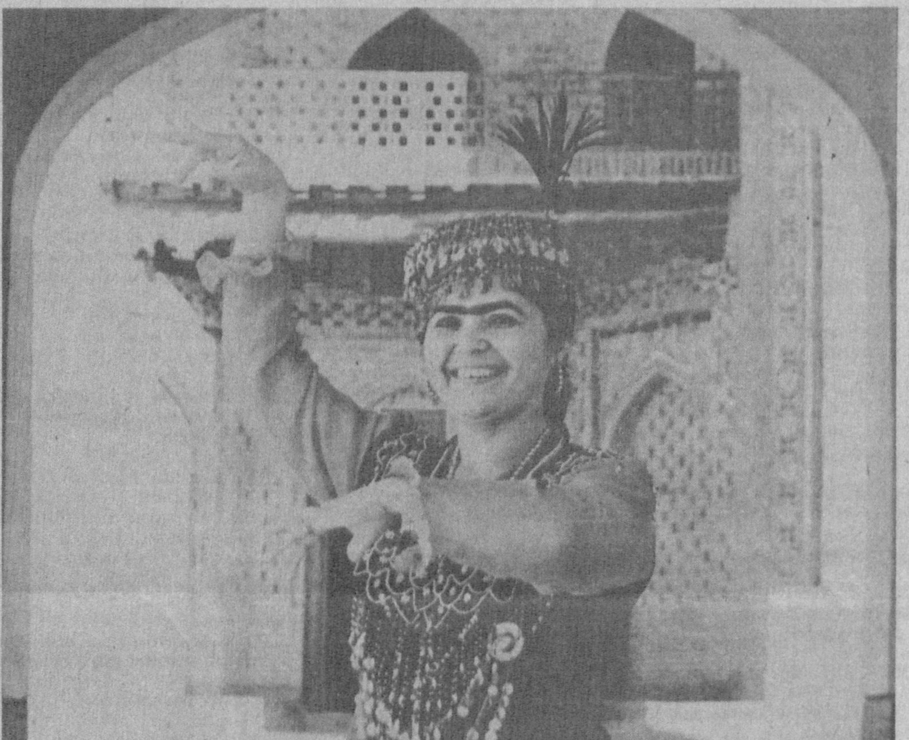
Мисоли нур каби руҳ кирди танга, Бармоқлар рақс этди кўйнинг сеҳридан. Минг йилки, яшайди «Лазги» Ватанда, Минг йилки, яшайди халқнинг меҳридан.

Мамлакатимиз мустақилликка эришгандан сўнг йилдан-йилга унинг чиройига чирой, кўрқига кўрк қўшилиб бормоқда. Шаҳримиз хиёбонларининг обод қилиниши, қадимий обидаларнинг таъмирланиши, янги замонавий иншоотларнинг барпо этилаётганлиги, республикамизнинг барча шаҳар ва кишлоқларида олиб борилаётган ободонлаштириш ишлари фикримиз далилидир.