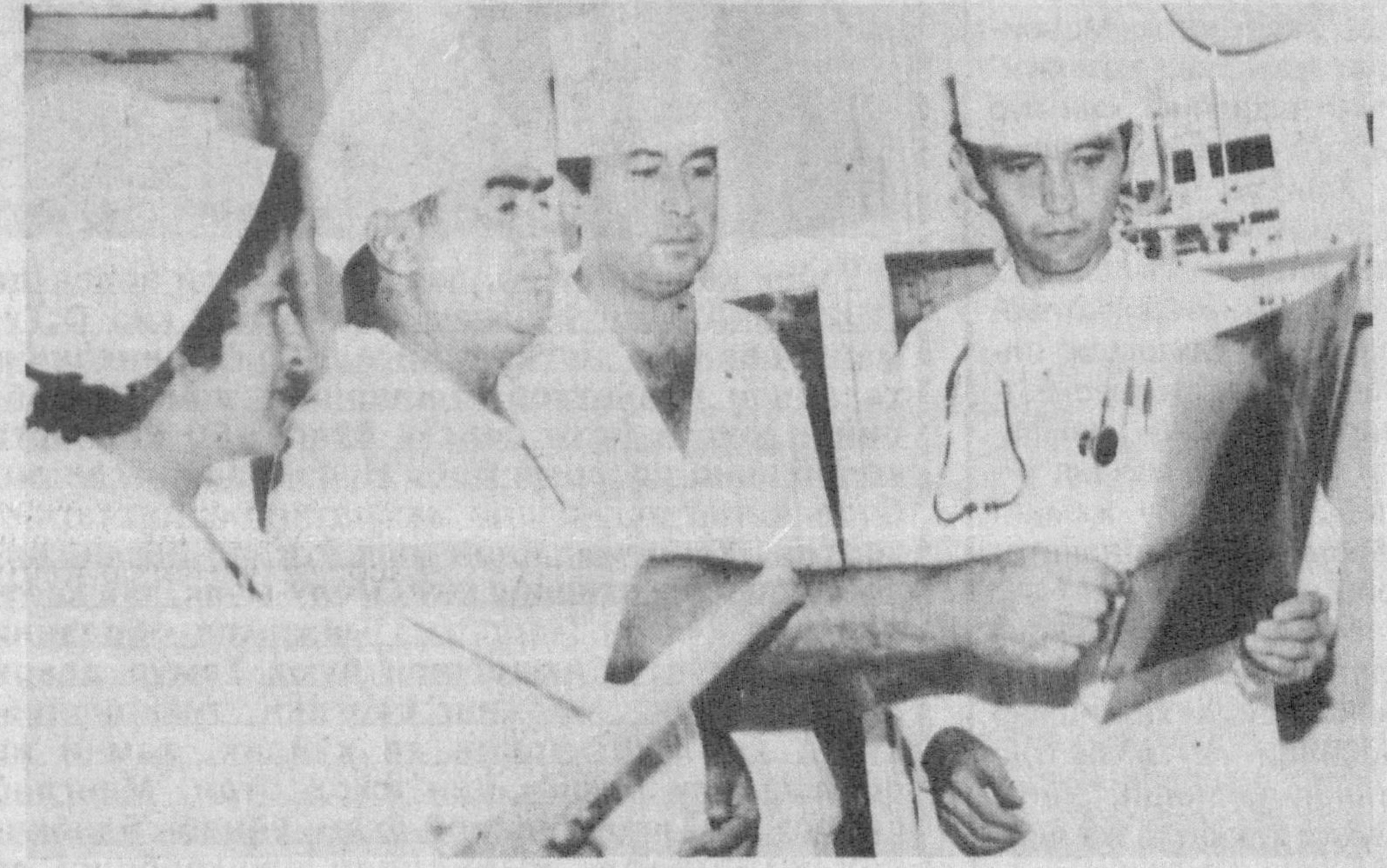
Ш.АКРОМОВ олган суратлар