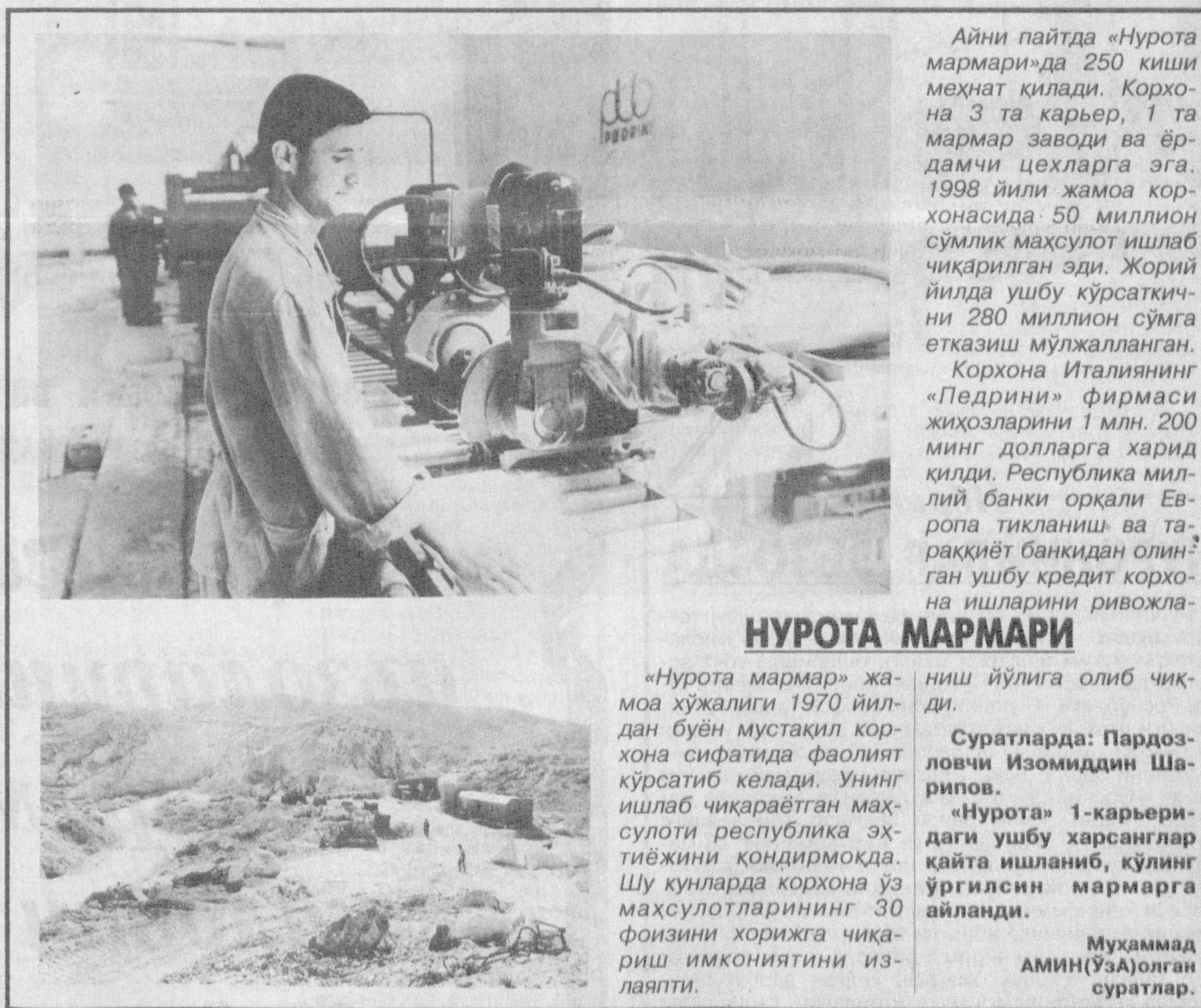
Айни пайтда «Нурота мрамари»да 250 киши меҳнат қилади. Корхона 3 та қарьер, 1 та мрамар заводи ва ёрдамчи цехларга эга. 1998 йили жамоа корхонасида 50 миллион сўмлик маҳсулот ишлаб чиқарилган эди. Жорий йилда ушбу кўрсаткич 280 миллион сўмга етказиш мўлжалланган. Корхона Италиянинг «Педрини» фирмаси жиҳозларини 1 млн. 200 минг долларга харид қилди. Республика миллий банки орқали Европа тикланиш ва тараққиёт банкидан олинган ушбу кредит корхона ишларини ривожланиш йўлига олиб чиқди.