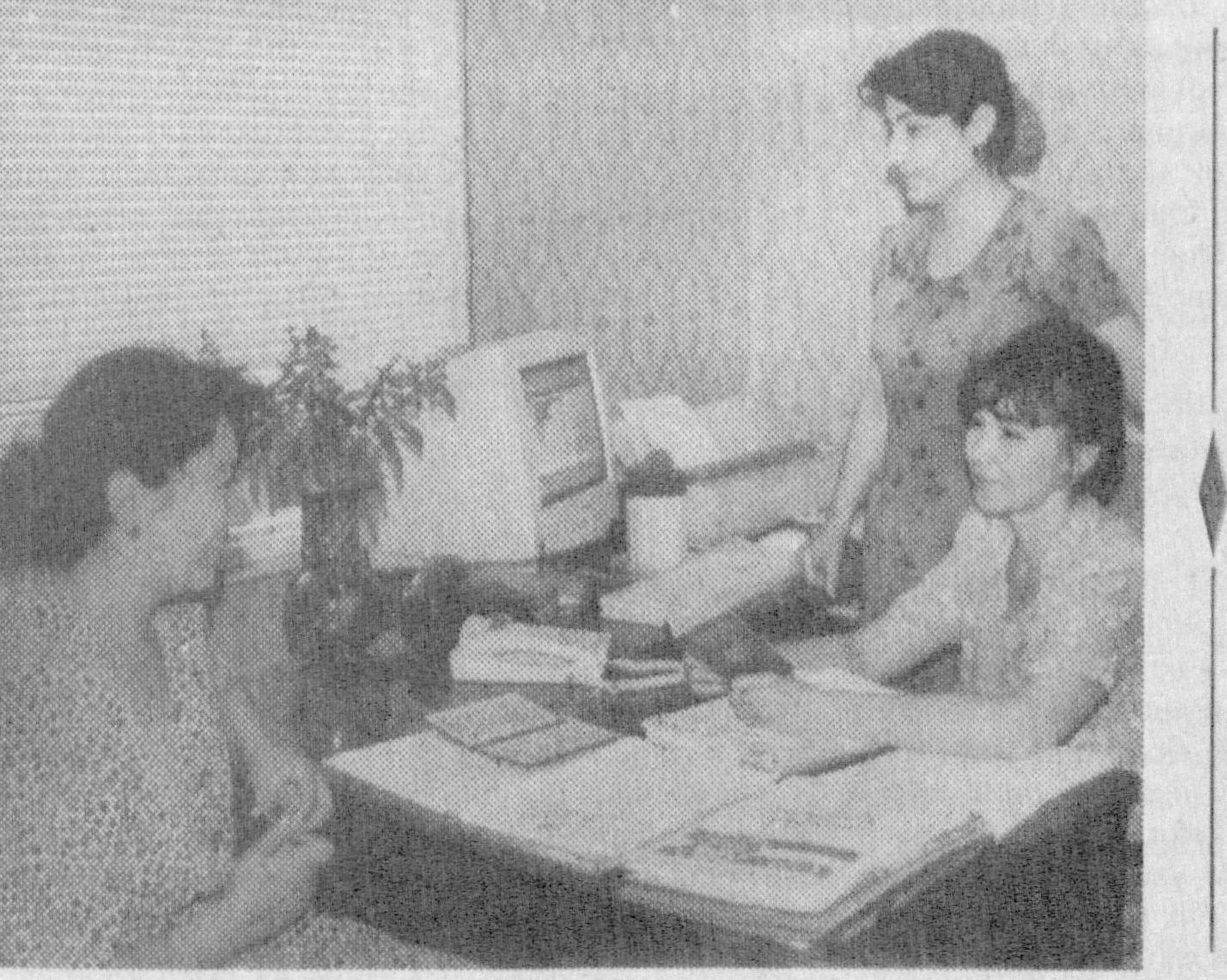
Қонунларга қатъий амал қилиш ҳуқуқий давлат қураётган мамлакатимиз фуқароларининг асосий бурчи ҳисобланади. Бу, айниқса, эндигина меҳнат фаолиятини бошлаётган ёш йигит-қизларга алоҳида масъулият юклайди.

Биз товар ва хизматлар учун нақд пулсиз ҳисоб-китоб юритишга эътиборни қаратяёмиз. Ярим йилликда 16 млн. сўмлик