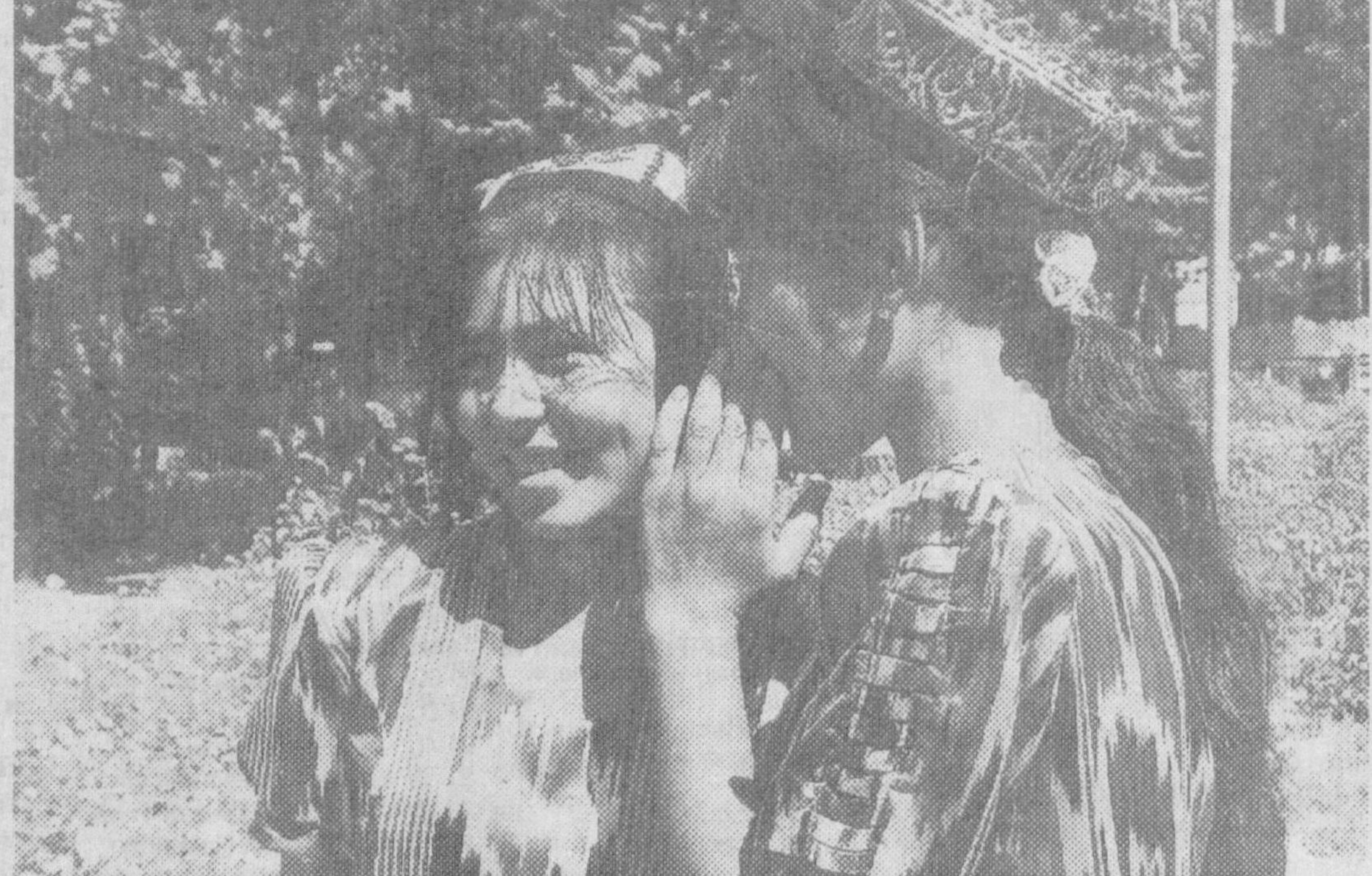
Ҳисларим уммони тошиб борадир, Сойнинг сувларидек шошиб борадир. Юракнинг сирларин айтолмай дилхун, Кўксимдаги бир қуш кўчиб борадир.

Математика, астрономия, фалсафа, табиёт, тилшунослик ва бошқа-бошқа соҳаларда жаҳон фанига катта хисса қўшган улуғ мутафаккир олимлар Фаробий, Беруний, Абу Али ибн Синоларни қадимги маданиятимизни бойитишда улкан хисса қўшган биринчи таржимонларимиз деб бемалол айтишимиз мумкин. Замон тақозосига кўра ўз асарларини араб тилида ёзган бу улуғ сиймолар бир қанча асарларини грек, форс тилларига таржима қилганлар. Урта аср шарқининг машҳур олими Абу Наср Форобийнинг заковати, истеъдодини алоҳида кўрсатиб ўтиш жоиздир. У бир неча шарқ тилларини, жумладан, араб тилини ўз она тилидаги билгани ҳолда, грек фалсафасини ўрганиш зарур бўлиб қолгани учун грек тилини ҳам билди олди. Олим кўп асарларини грек тилидан араб тилига таржима қилди. Абу Райхон Беруний «Ҳиндистон» деган машҳур китобини ёзиш учун хинд тилини синчиклаб ўрганиб чиқди. Олим ўз асарларини араб тилида ёзгани ҳолда хиндча битилган китоблардан ҳам фойдаланди, хинд тилидан кўпгина асарларни таржима қилди. Хинд олимлари ўз тилларида Берунийни «дарё» деб аташган. Берунийнинг хинд тилидан араб тилига таржима қилган ва ҳозир фан оламига маълум бўлган асарлари орасида «Кхандакхадьяка» («Ал Арканда жадвали») ҳам бор. Беруний хинд ҳикоялари тўплами «Калила ва Димна» асарини таржима қилиш орзусида эканлигини ҳам ёзган эди.