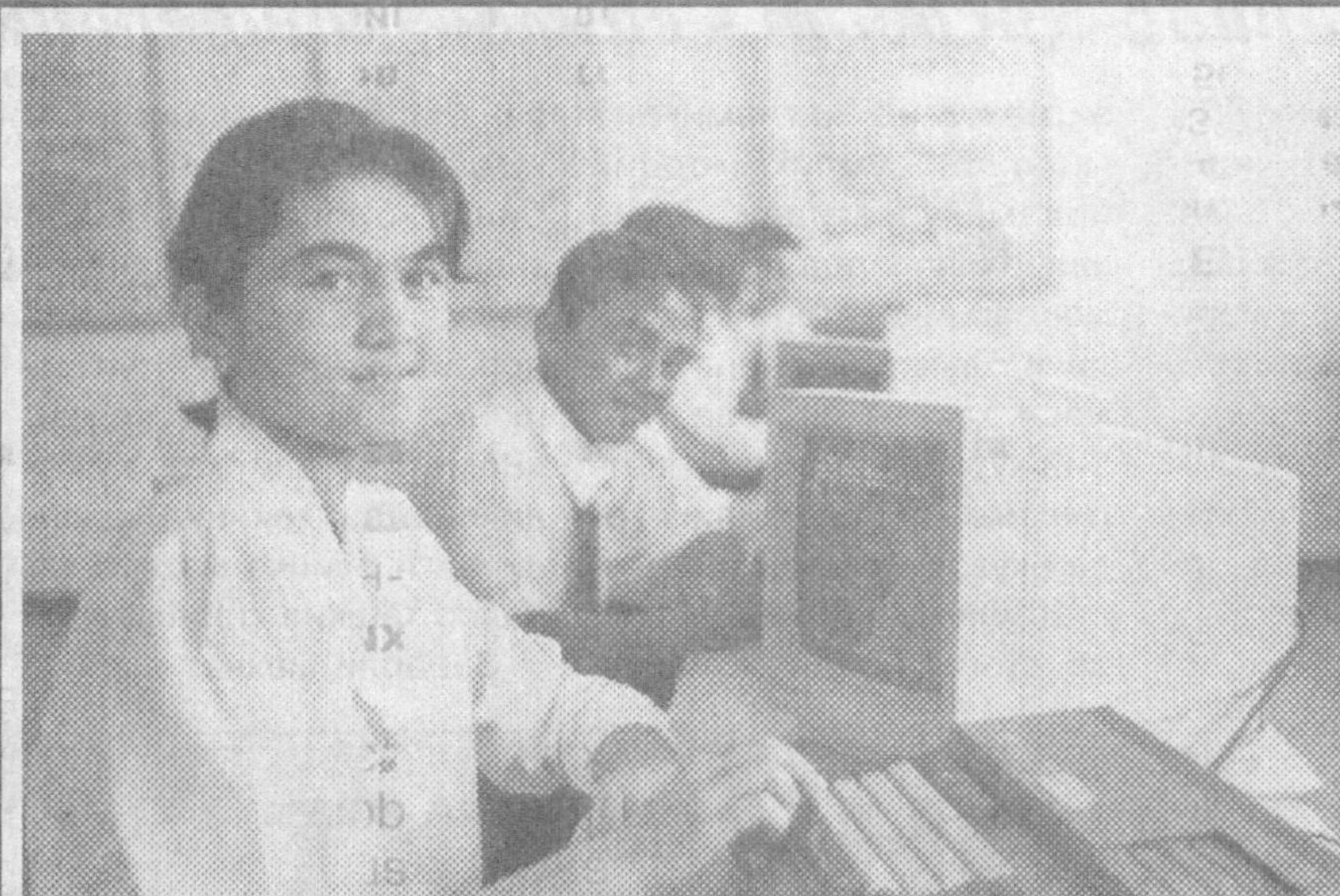
Мамлакатимизда ёшларнинг ҳар томонлама баркамол ворислар бўлиб етишлари учун алоҳида меҳрибонлик кўрсатилмоқда. Бу муҳим ишга Қашқадарё вилоятида ҳам алоҳида эътибор билан қаралмоқда. Сентябрь ойида Қарши шаҳрида иш бошлаган 750 ўринли