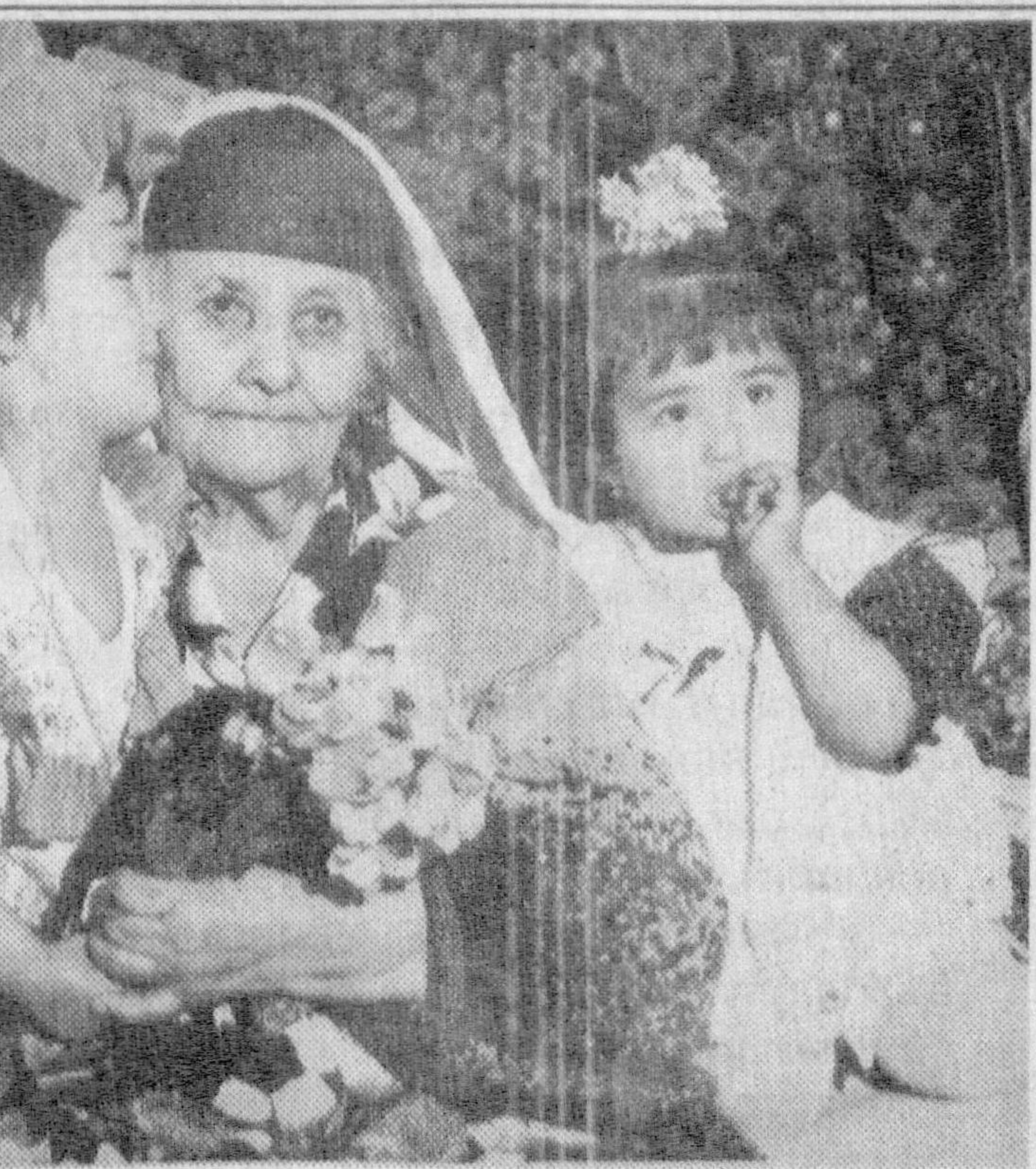
Данагидан мағзи ширин...

Орауларингиз. Орауим ҳеч ким ногирон бўлиб қолмасин. XXI асрда ер юзюнда, хусусан, Ўзбекистонимизда биронга ҳам ногирон бўлмасин. Бунинг учун ҳар бир эркакга аёл ўзини зарарли ишлардан тийиши лозим. Ниятим юртимиз осмонни мусалфаф, ҳар бир оилада тотувлик бўлсин.