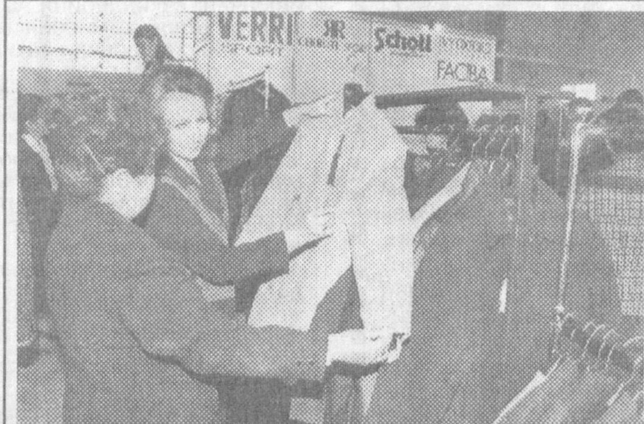
«ЭКСПО ИТАЛИЯ - 99»