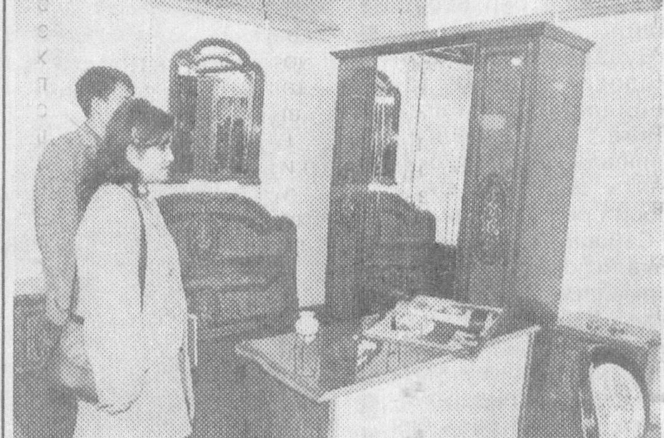
Тошкентдаги ЎзЭКСПО марказида Италия мамлакатининг технология ва ускуналари кўргазмаси очилди.