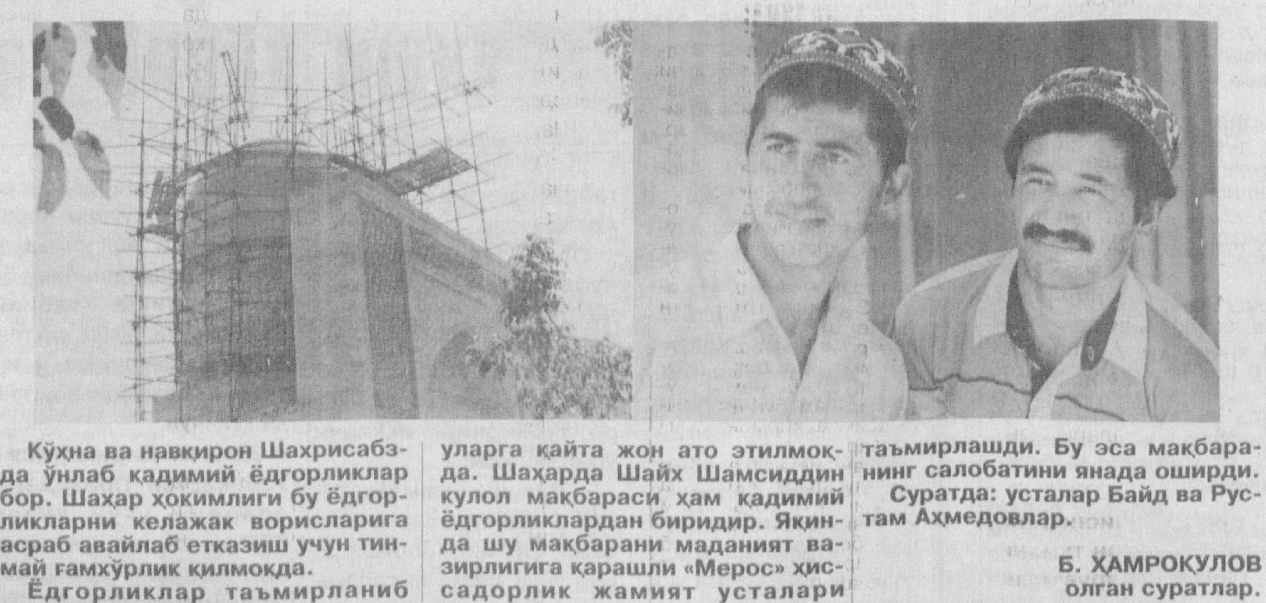
Кўхна ва навқирон Шахрисабзда ўнлаб қадимий ёдгорликлар бор. Шаҳар ҳокимлиги бу ёдгорликларни келажак ворисларига асраб авайлаб етказиш учун тинмай гамхўрлик қилмоқда.