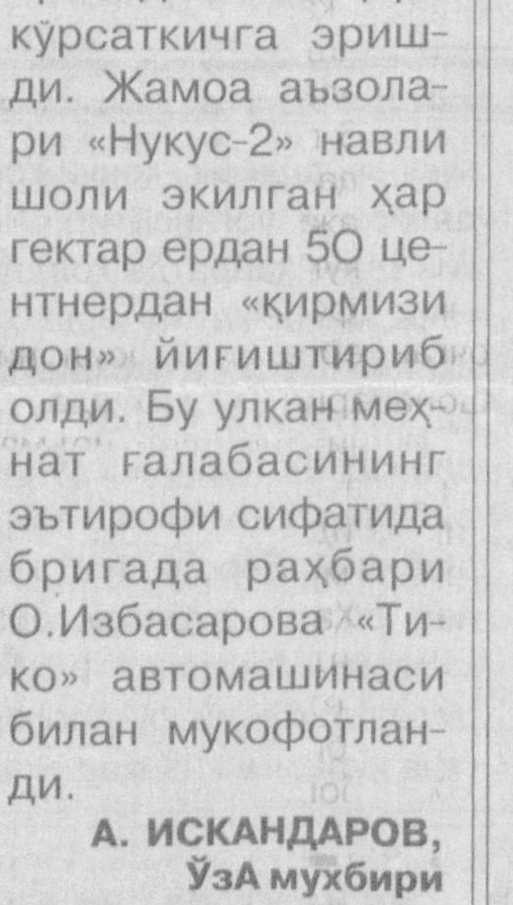
«Тико» автомашинаси билан мукофотланди.

банди, 101,107,108 ва 237 моддаларига эйдир. Шу сабабли инспекция маъмуриятнинг юқоридаги буйруғини бекор қилиш, меҳнат кодексининг 111,112 ва моддаларига асосан Э.Қосимовани илгарини ишлаган вазифасига тиклаш, ходимнинг маъмурият айби билан бекор қолган даври учун уртача иш ҳақи миқдориде тегишли маош билан таъминлаш ҳақида қўриққич берди. « Ҳақиқат қарор топди. Лекин бизни бир нарса уйлантиради. Наҳотки таълим-тарбия билан машғул бўлган катта меҳнат жамоасини бошқаравтган олий маълумотли педагог раҳбар меҳнат қонунларидан беҳабар бўлса, наҳотки у хомилларда аёлга нисбатан охириги чорани қўллашда етти улчаб бир кесил лозимлигини билмасаса...» Раҳимжон ҚОМИДОВ, «Ишонч» мухбири.