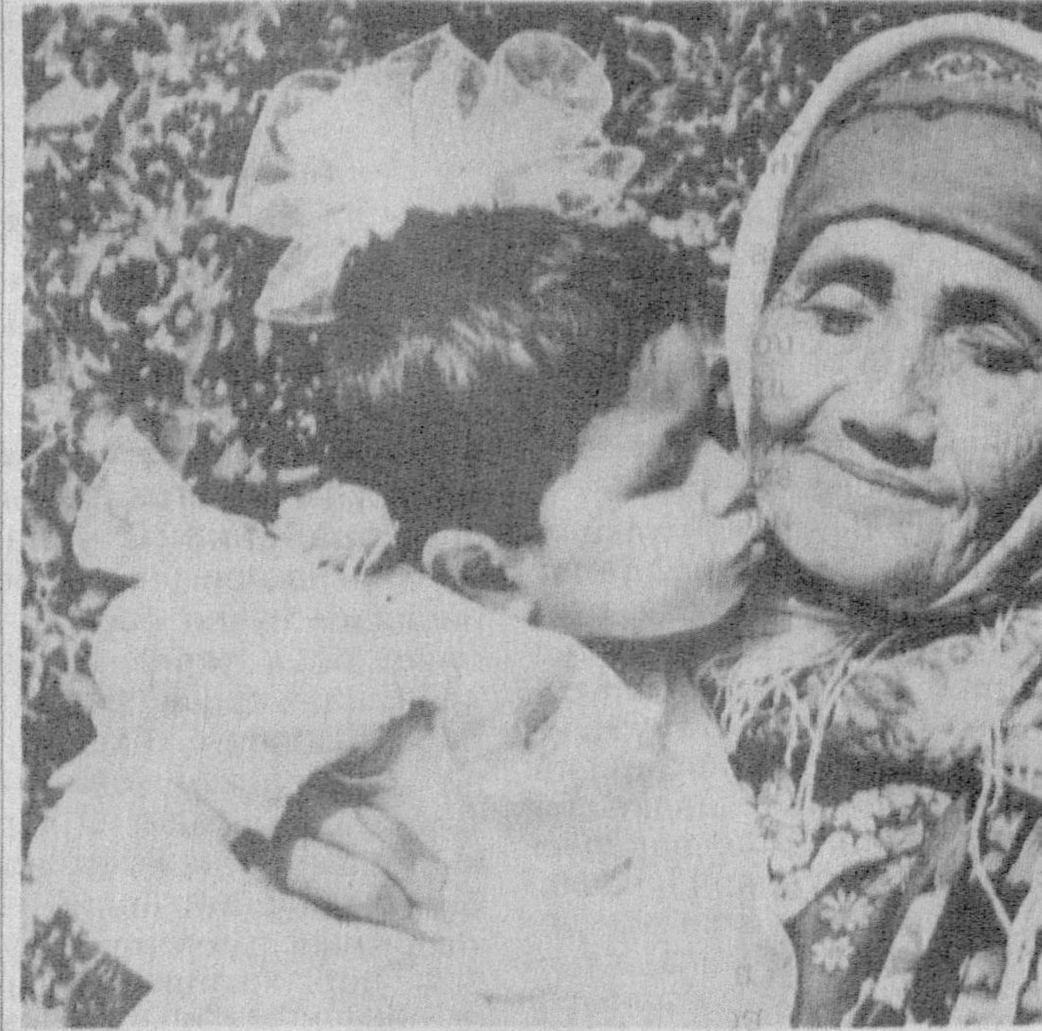
Алла айтинг, бувижон, Аллангизни соғиндим. Тинглаб топар роҳат жон, Яллангизни соғиндим.