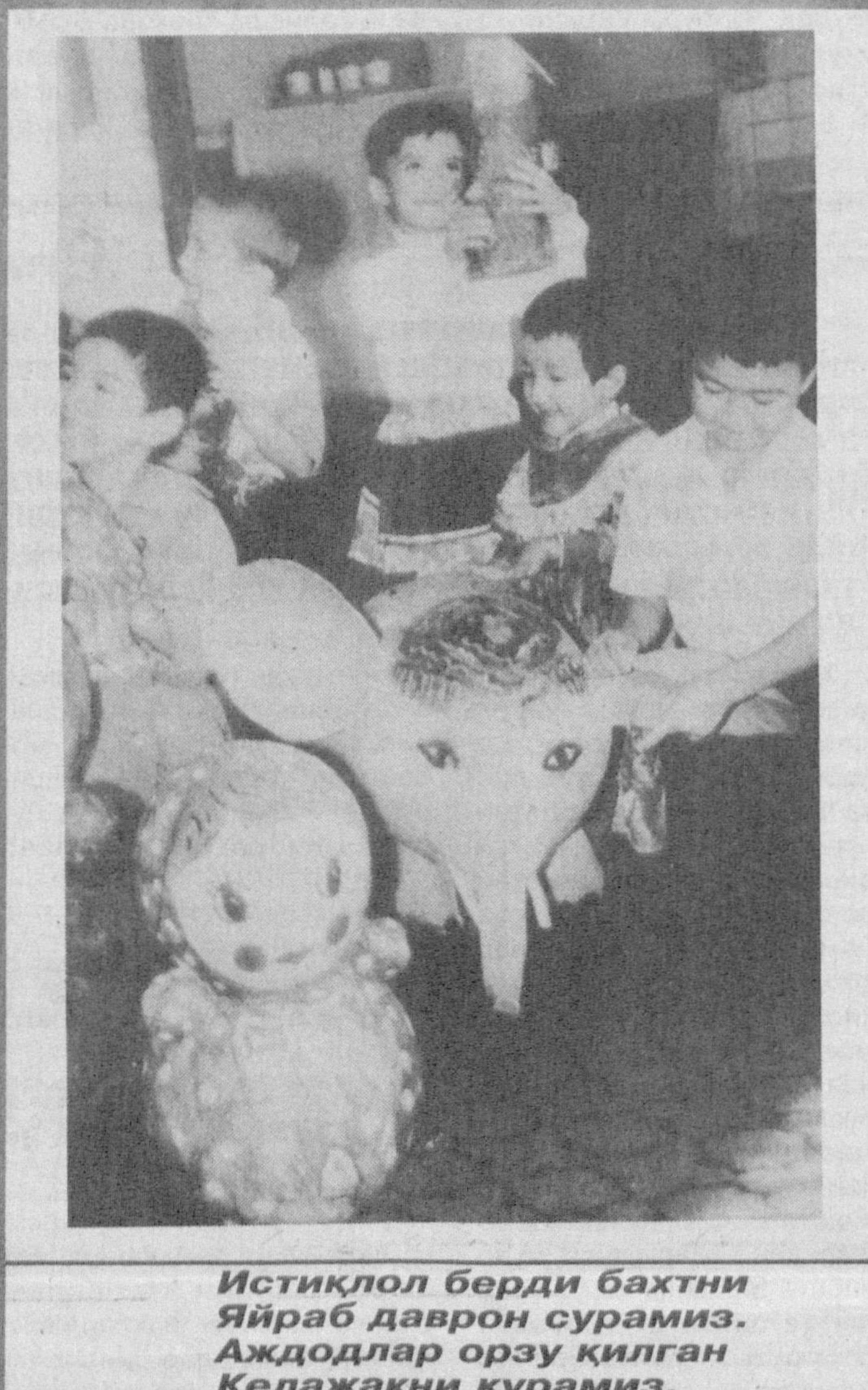
Истиклол берди бахтни Яйраб даврон сурамин. Аждодлар оруз қилган Келажакни қурамин.