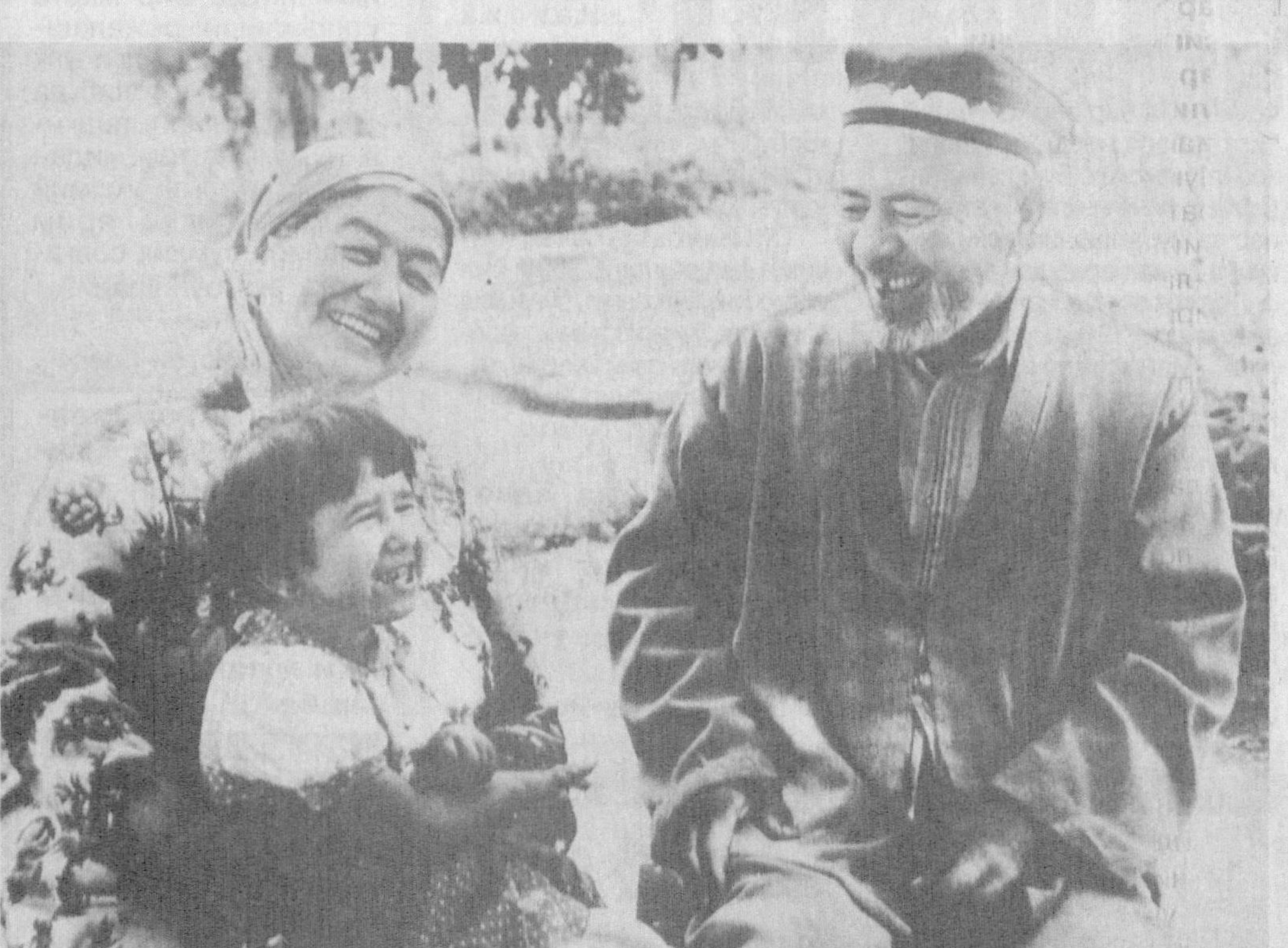
Кўк юзини қоплаган, Булутлар нари кетсин. Бахт куёши порлаган, Қулишга нима етсин.