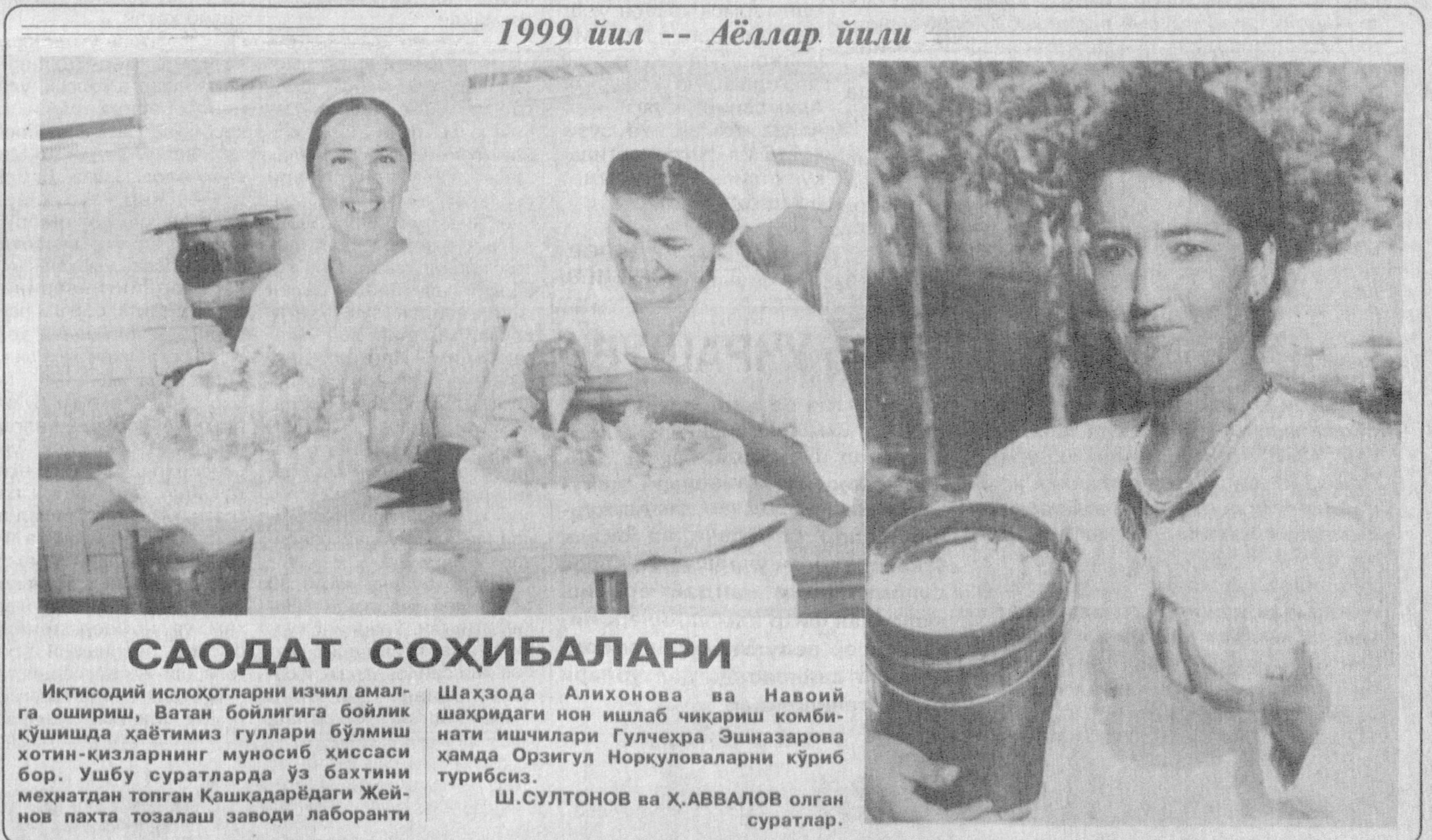
1999 йил -- Аёллар йили