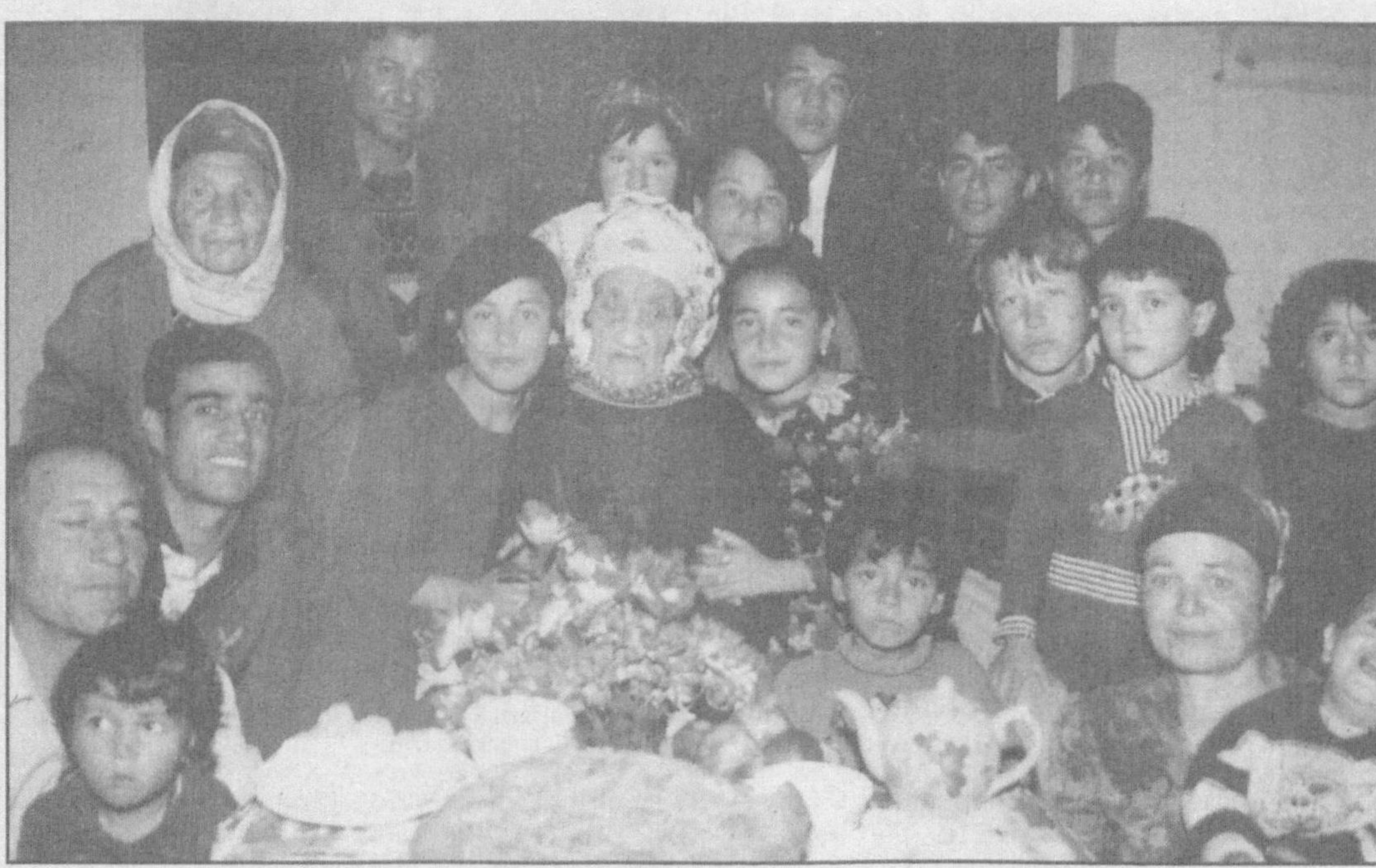
117 ёшли ўғилсафар момо оила аъзолари даврасида.