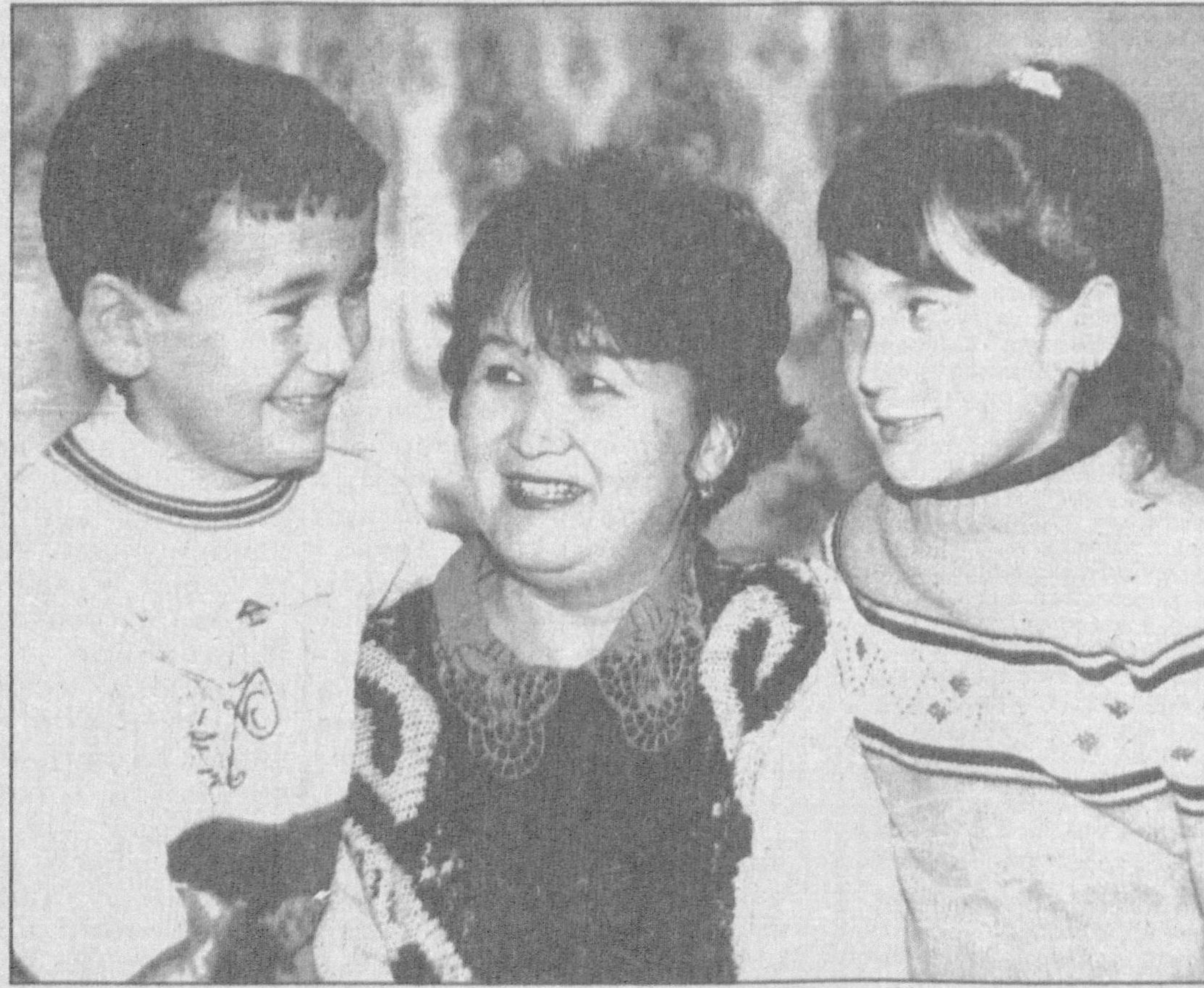
Алпомиш авлодисиз, Мардона лочинимсиз.