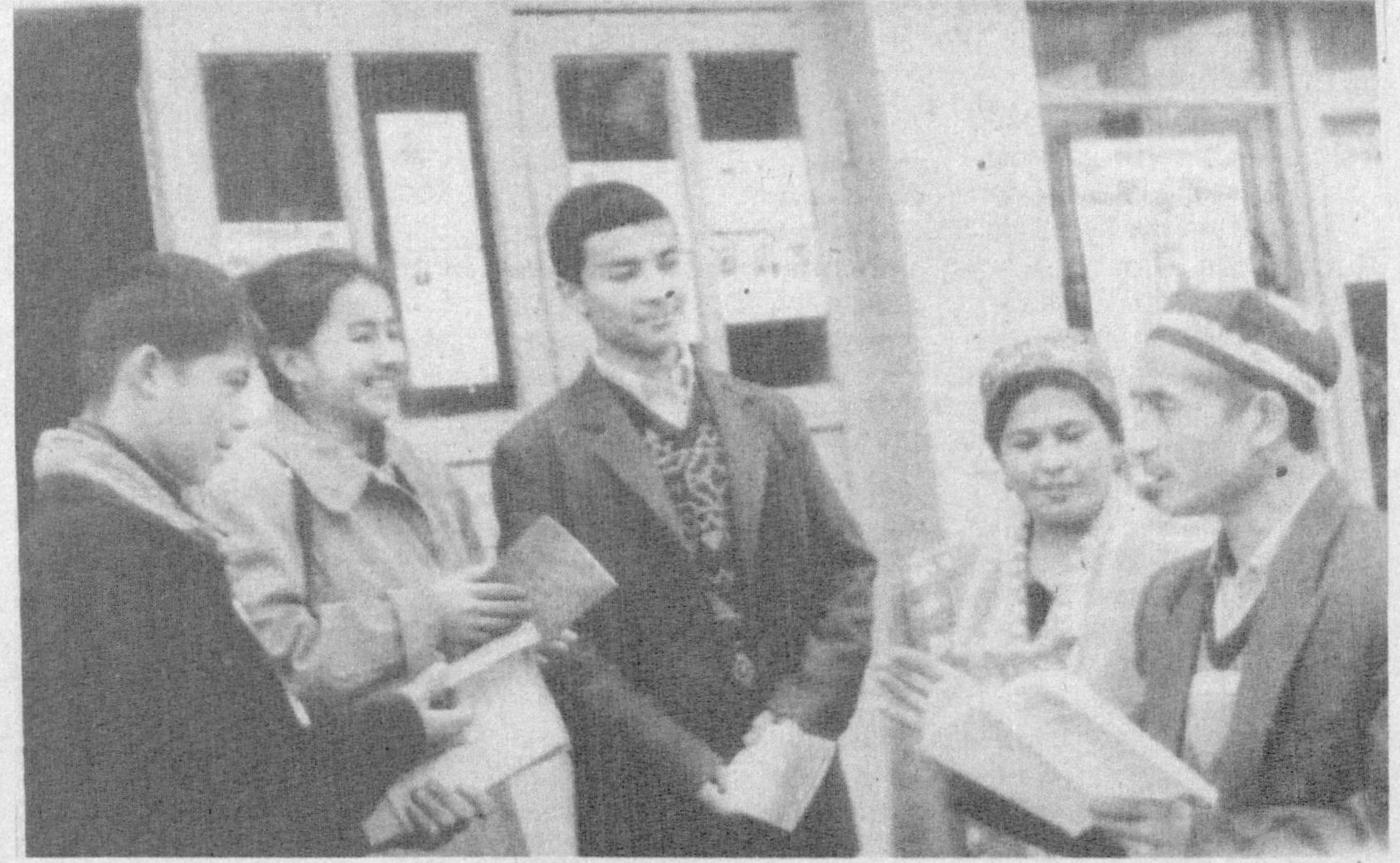
Китоб туманининг Севаз қишлоғида Бизнес мактаби ташкил қилинганлигига кўп вақт бўлгани йўқ. Бу ерда 650 нафар талаба 12 йўналиш бўйича касб-хунар ўрганишади. Сайловларда илк бор овоз бериш ҳуқуқига эга бўлган ушбу даргоҳ тингловчиларининг қувончи чекиз.