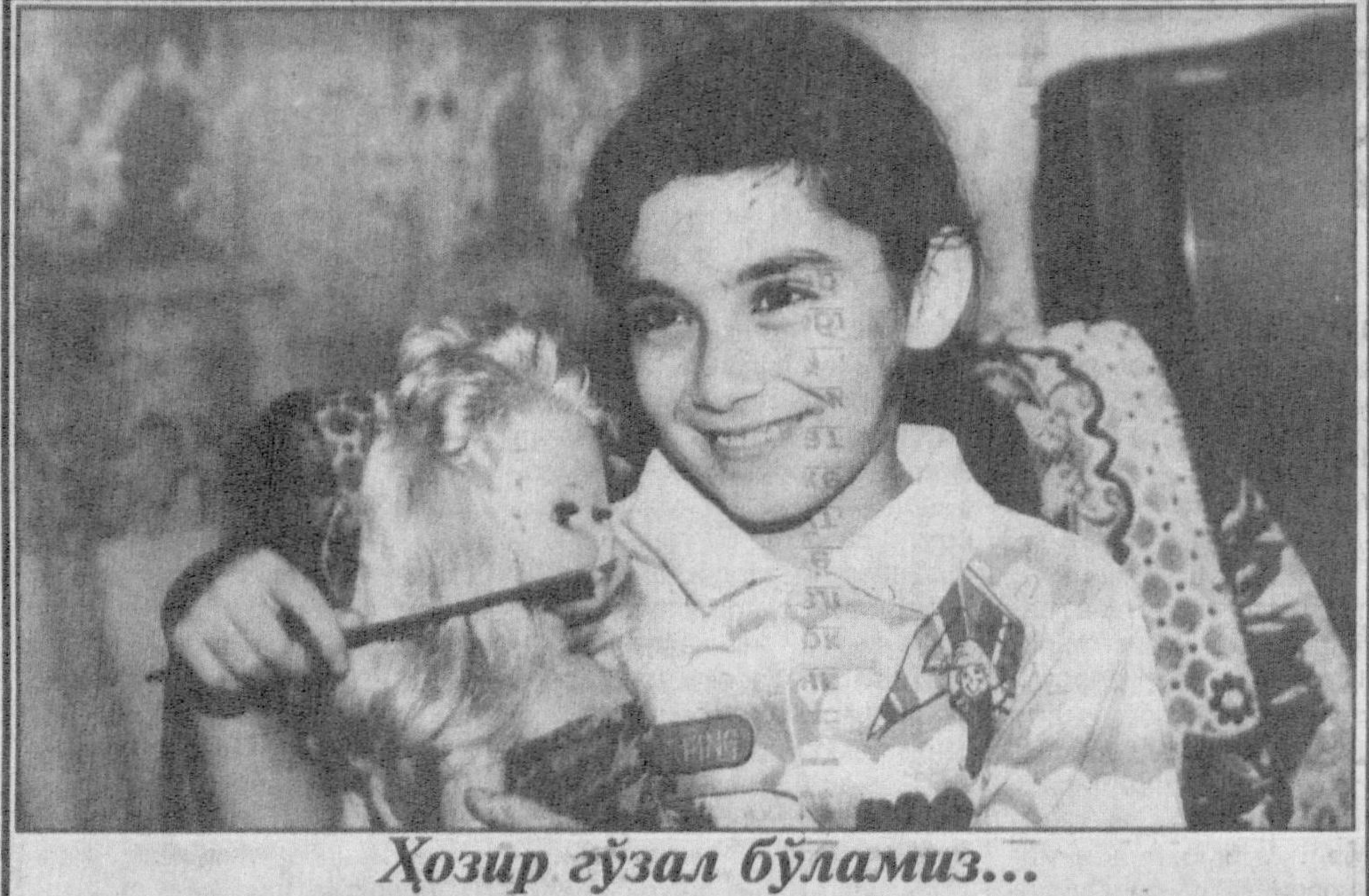
Ҳозир гўзал бўламиз...

Бразилиядаги Сан-Паулу газеталарида кўйидаги мазмунда эълон ёзилди «Мен томонидан «Фуртадо» универмагада Жакартадан келтирилган илонлар солинган сават йўқолди. Уни топиб менга келтириб берганга катта миқдорда суюнчи берилди». Шундан кейин универмаг бутунлай ҳувилаб қолди. Натияжада хариддорлар бу ерга кирмай қўйдилар. Бу ҳол 3 кун, бир ҳафта давом этди. Магазин ходимлари универмагда бирорта ҳам илон топилмагани ҳақида эълон қилишди. Маҳаллий телевидениеда чиқиш уюштирилди ва хатто молларнинг нархлари 2 бараварига пасайтирилди ҳам, бироқ бари самарасиз бўлди. Ушбу магазин хўжайинининг гапига қараганда, бу рақобатчиларнинг ўйлаб топган ажойиб ҳийласи экан.