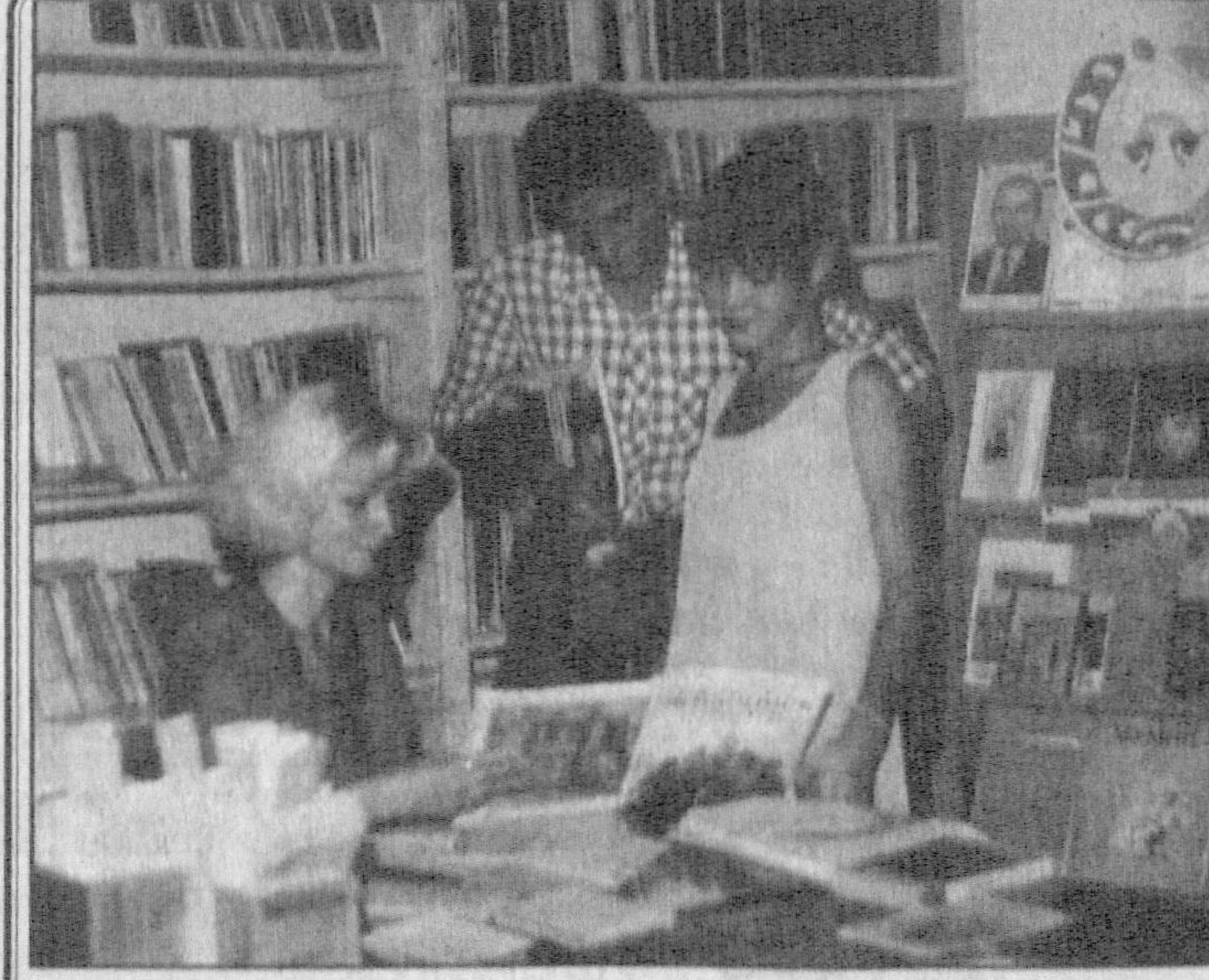
Умр мазмуни фақат моддий нэматлар билангина ўлчанмайди. Инсон учун маданий-маънавий эҳтиёжини қондириш муҳим аҳамиятга эга.

Икки ярим минг ишловчига эга бўлган Самарқанд кимё корхонаси касабаси уюшма