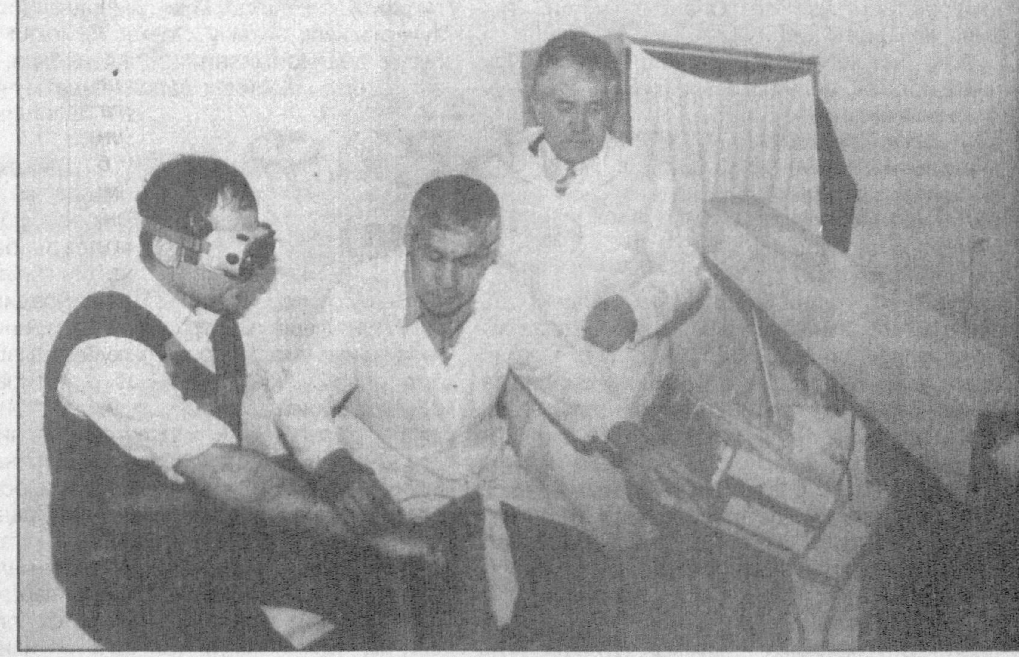
Суратда: санаторий-даволаш жараёни.

Тахлиллар шуни кўрсатаётдики, санаторий-профилакторийларда даволанганларнинг ҳасталиниши 45 фоизга камаймоқда. Буни Самарқанд кимё заводида қарашли санаторий мисолида ҳам кўришимиз мумкин. Замонавий тиббий ускуналар билан жиҳозланган шифоҳонада игна-терапия, шифобахш сув ва балчиқ билан даволаш каби янги усулларнинг қўлланиётгани миждоҳларни хушнуд этмоқда.