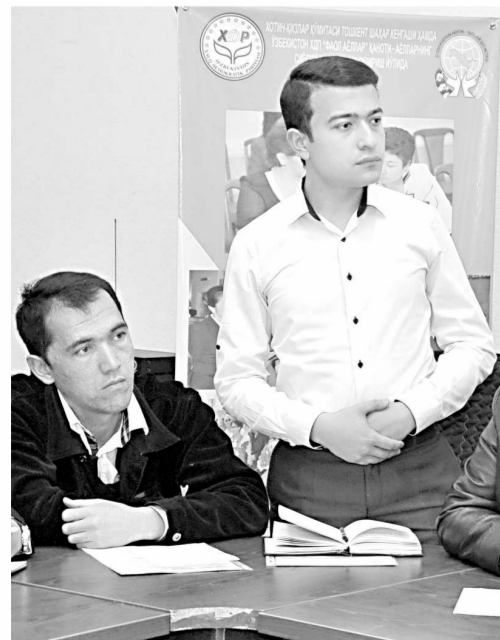
► Давоми. Боши 1-бетда.