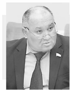
Анвар БОЙҚУЛОВ, Олий Мажлис Қонунчилик палатаси депутати, Санаят, қурилиш ва савдо масалалари қўмитаси аъзоси.