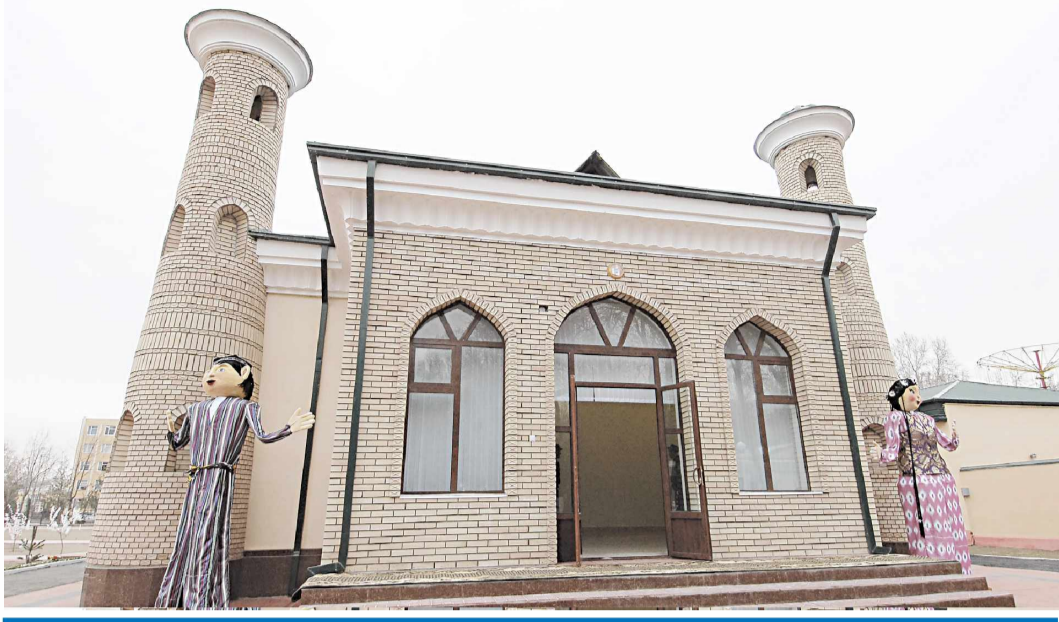
2014 йил — соғлом бола йили

Юртимизда келажакимиз ворислари бўлмиш болажонларни бой маънавий меросимиздан баҳраманд этиш, уларни миллий қадриятларимиз руҳида тарбиялаш мақсадида кўплаб ишлар амалга оширилмоқда. Фарғона шаҳридаги ал-Фарғоний хибонининг янгидан кенгайтирилган қисмида кўғирчоқ театри биносининг қуриб битказилгани ҳам болаларимизга кўрсатилаётган ғамхўрликнинг яна бир ёрқин ифодасидир.