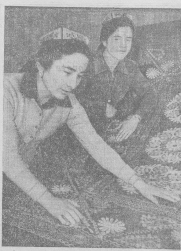
Народные контролеры на Самаркандской художественно-ковровой фабрике (а их здесь работает более 70) повседневно борются за высокое качество продукции, за экономию электроэнергии, сырья и материалов.

Председатель районного комитета народного контроля. Кургантинский район.