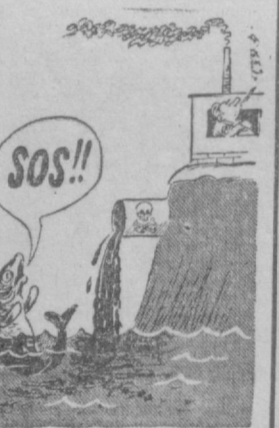
Рис. В. Махнамова.

И вот, можете себе представить настроение людей, полных стремления работать лучше и лучше, но вместо этого вынужденных часами простаивать из-за отсутствия инертных материалов. Как, например, можно выпустить в апреле 4.400 кубометров железобетонных изделий, если песка завезено очень мало?