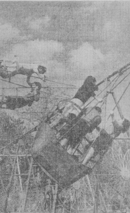
В воскресный день в ташкентском парке имени Горького.