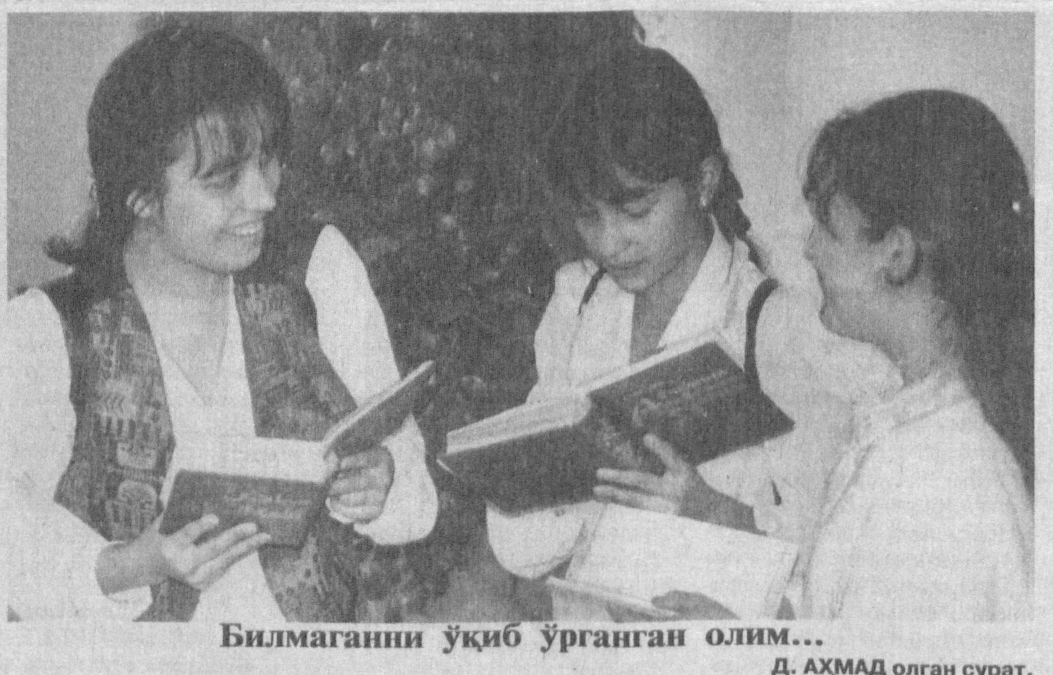
Билмаганини ўқиб ўрганган олим...

162 истиқболли боксчилари ўз кучлари ва маҳоратларини синаб кўришди. Мусобақада Анджон шаҳри республика олимпия резервлари билим юртининг ёш спортчилари голиб деб топилди.