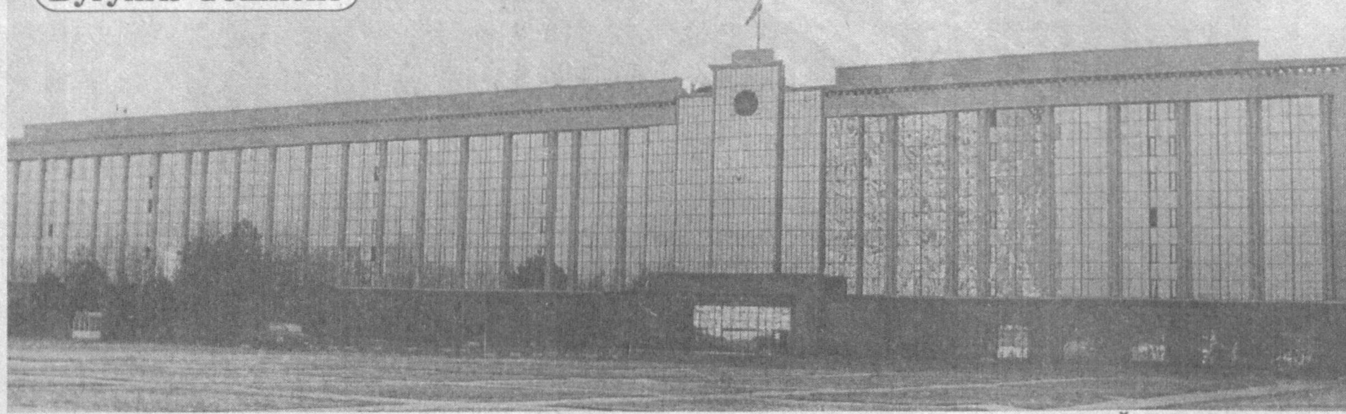
К. ТУРАЕВ олган сурат.