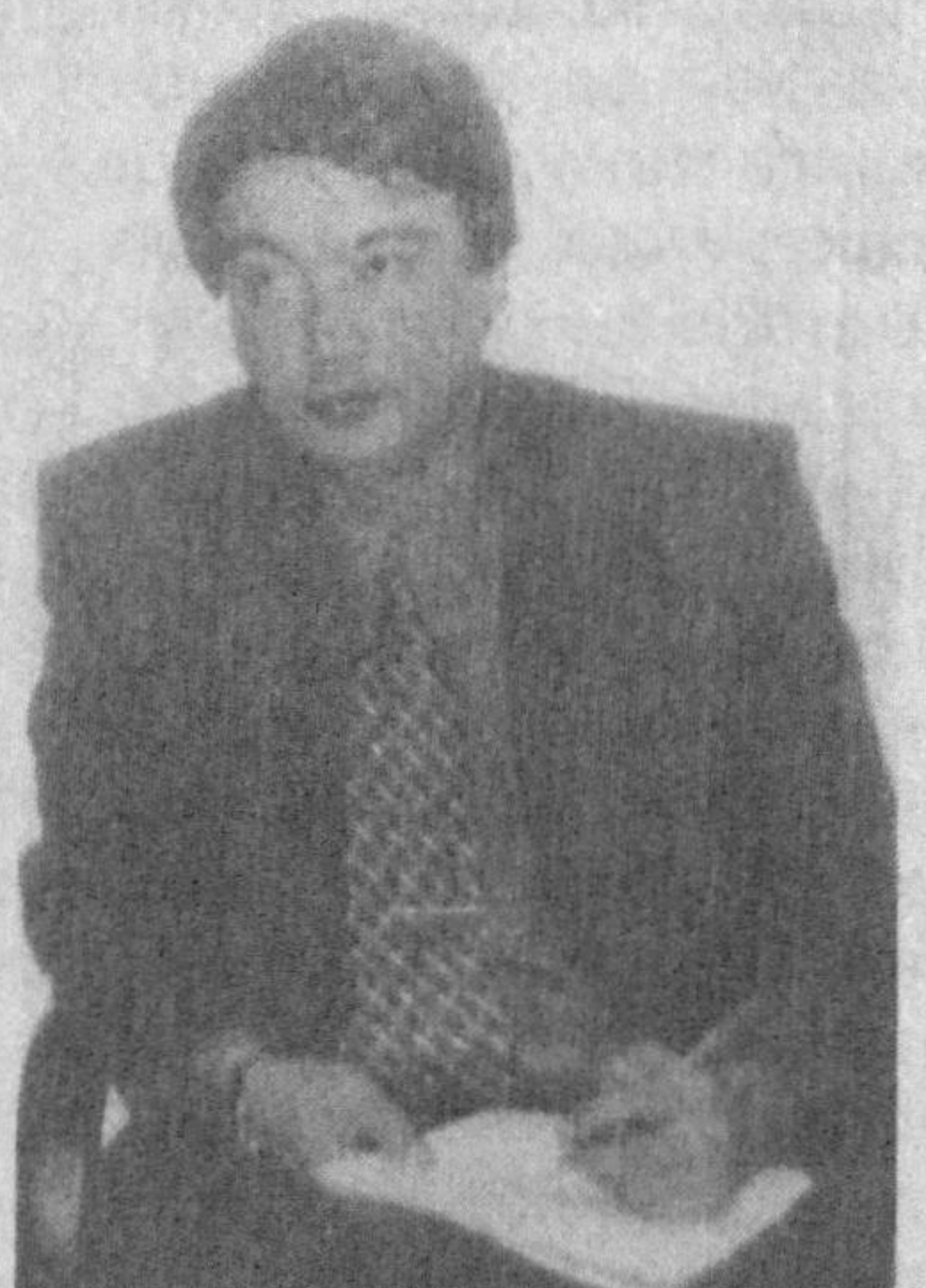
ҳида «Алоқа-500» УЗИ ва Toshiba аппаратлари ёрдамида беморларга тиббий ёрдам кўрсатаяпти.