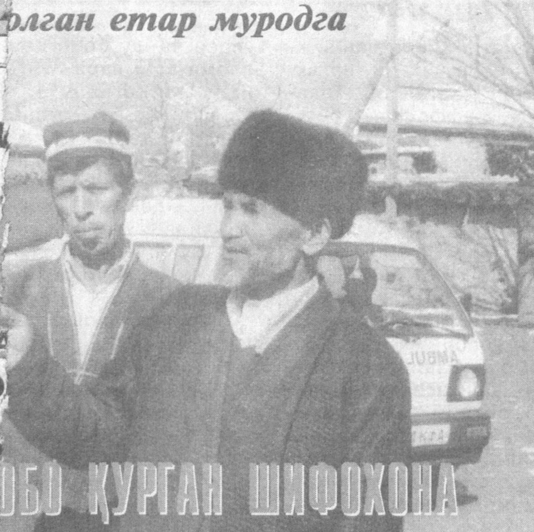
Бундан 30-40 йил му...