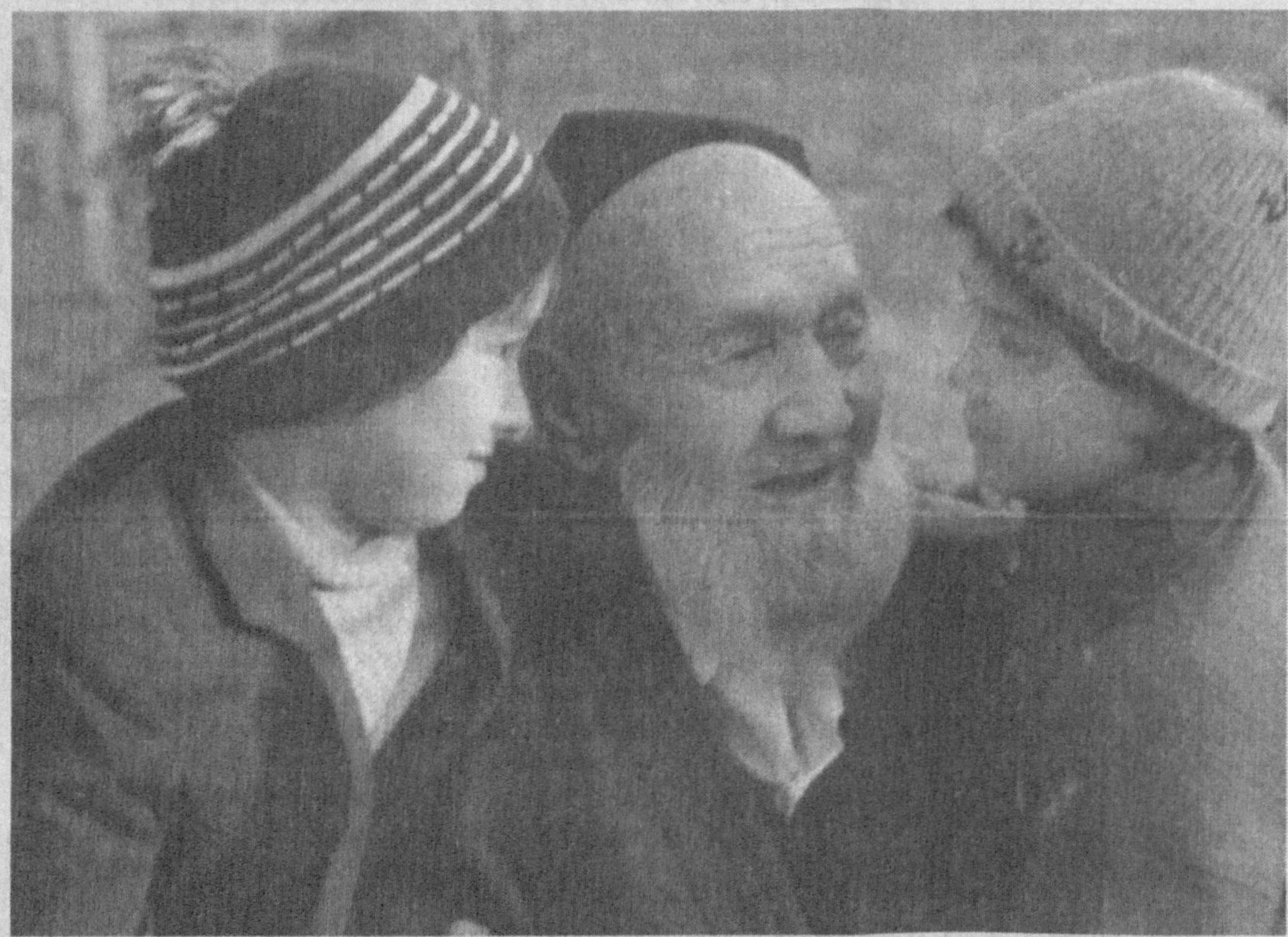
Кексаликнинг гашти ажиб, ўзгача, Ҳар асно, лаҳзаси мўъжиза, сеҳр. Қанийди яшаса ҳамма... юзгача! Ва кўрса ҳамisha самимий меҳр.

ҳамиша одамларга яхшиликлар олиб келган. Дунёдаги барча эзгуликларнинг асосида ғайрат ётади, десак муболаға бўлмайди. Ғайрат муваффақиятлар гарови, зафарларнинг сабабчиси дур. Аксинча, сусткашлик туфайли бўладиган иш ҳам бўлмайди. Публилий Сир бу ҳақда шундай дейди: «Сусткашлик — фақат ғазабланган вақтдагина фойдали». Ибратли ҳикмат, маъқул