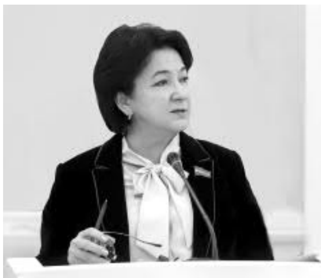
Кизилгул ҚОСИМОВА, Олий Мажлис Қонунчилик палатаси депутати, ЎзХДП фракцияси аъзоси:

— Халқ саломатлиги, миллат генофондининг мустаҳкамлиги ҳар бир давлат учун беназир бойликдир. Бу жуда долзарб масала бўлганлиги учун ҳам янгиликлар Конституцияда аҳоли саломатлигини асраш билан боғлиқ нормалар бир неча баробарга оширилди.