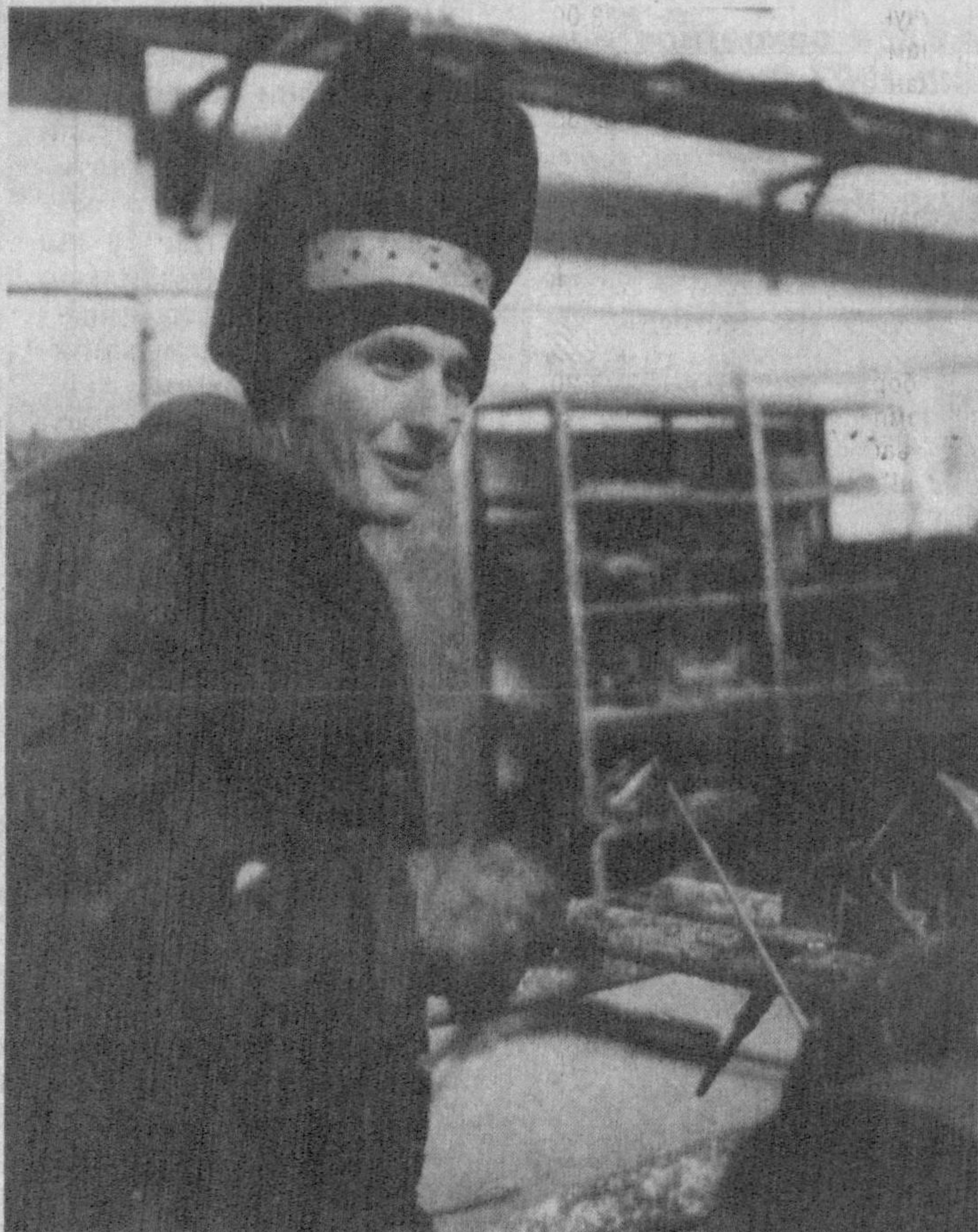
Қонун — барчага баробар

Фермер хўжалиқлари етиштирган қишлоқ хўжа- ли маҳсулотларини аҳолига сотишни ташкил- лаштириш мақсадида ту- манларда 16та қассобхо- на, 7та махсус дўкон таш- кил этилди. Мирзачўл ту- манидаги фермер хўжа- лиқлари маблаг ҳисоби- га туман марказида 470