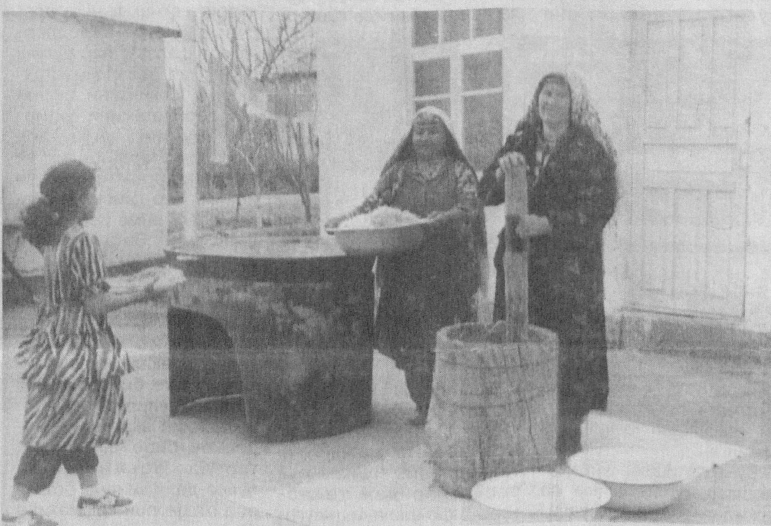
Маҳалланг - отанг, онанг