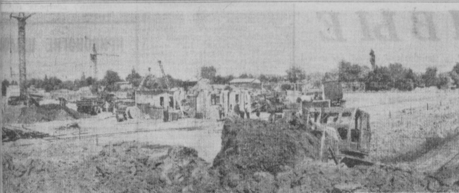
На бывших полях колхоза «Москва», что в районе Актепа, раскинулась большая строительная площадка. Здесь для ташкентцев возводятся жилые дома, культурно-бытовые, торгово- и административные здания строителями из Москвы, Киева, Одессы, Львова, Днепропетровска, Донецка, Фрунзе. На снимке: панорама стройки.