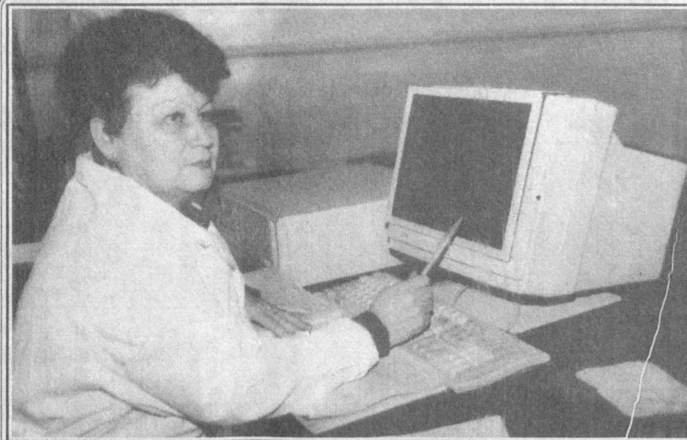
«Дар-АС-Салом» Янгийўл дон маҳсулотлари очик турдаги ҳиссадорлик жамиятида бугунги кунда турли миллат вакилларидан иборат 325 нафар ишчи-хизматчи самарали меҳнат қилмоқда. Бу ерда бир кунда 100 тонна ун