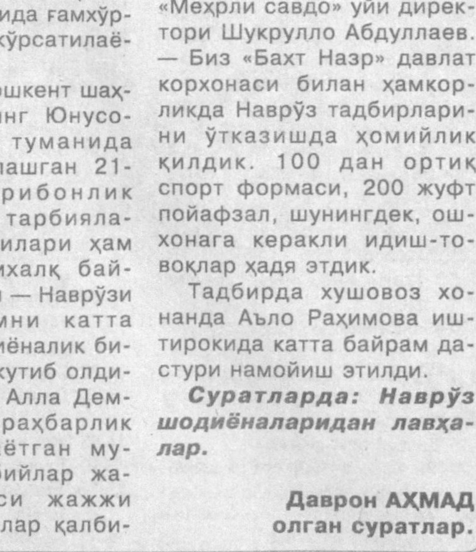
Даврон АХМАД олган суратлар.

... Замондош ровийлар андоқ ривоят қилмишдишларким, Тошканди азим қалам аҳлининг бир гуруҳи Наврўз арафасида халфана у сулинда сумалак солмишлар. Албатта, дошқозон атрофида бола-бақралар, заифалар андармон. Адилларимиз эрса бир пийла чой устинда сумалак маҳинда андак мушоира қилмишларким, ушбу гуруннинг қисқача баёни шул турсур.