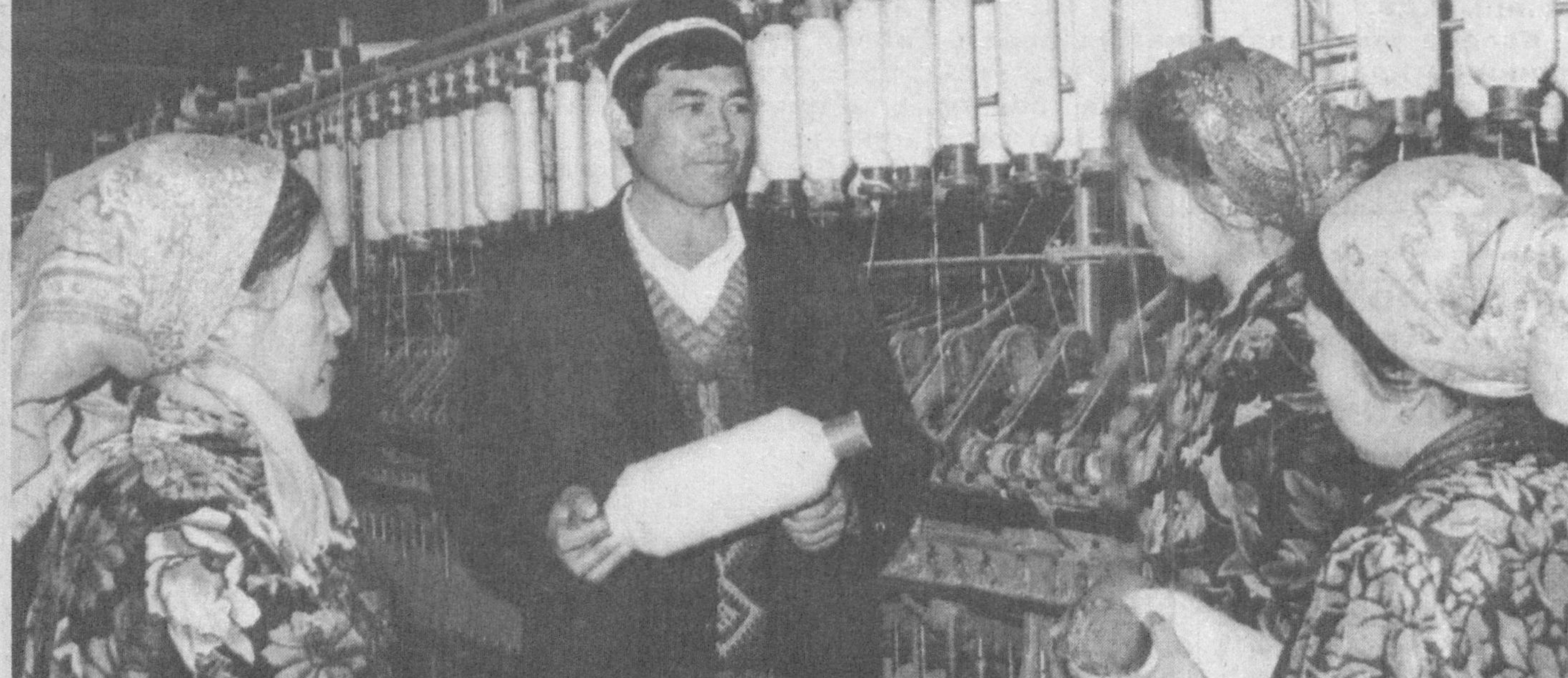
Чирочки туманидаги нотўқима очик ҳиссадорлик жамияти учинчи кварталдан бошлаб пахтачи қайта ишлаш заводи-ларига керакли беш турдаги махсусотни етказиб беради. Корхонада тайёрланаётган тоиланган толани ўрашда ишловчиладиган махсус мато харидорлиги билан эътиборлидир.

Жамият маъмурияти яна бир муҳим ишни зимма-