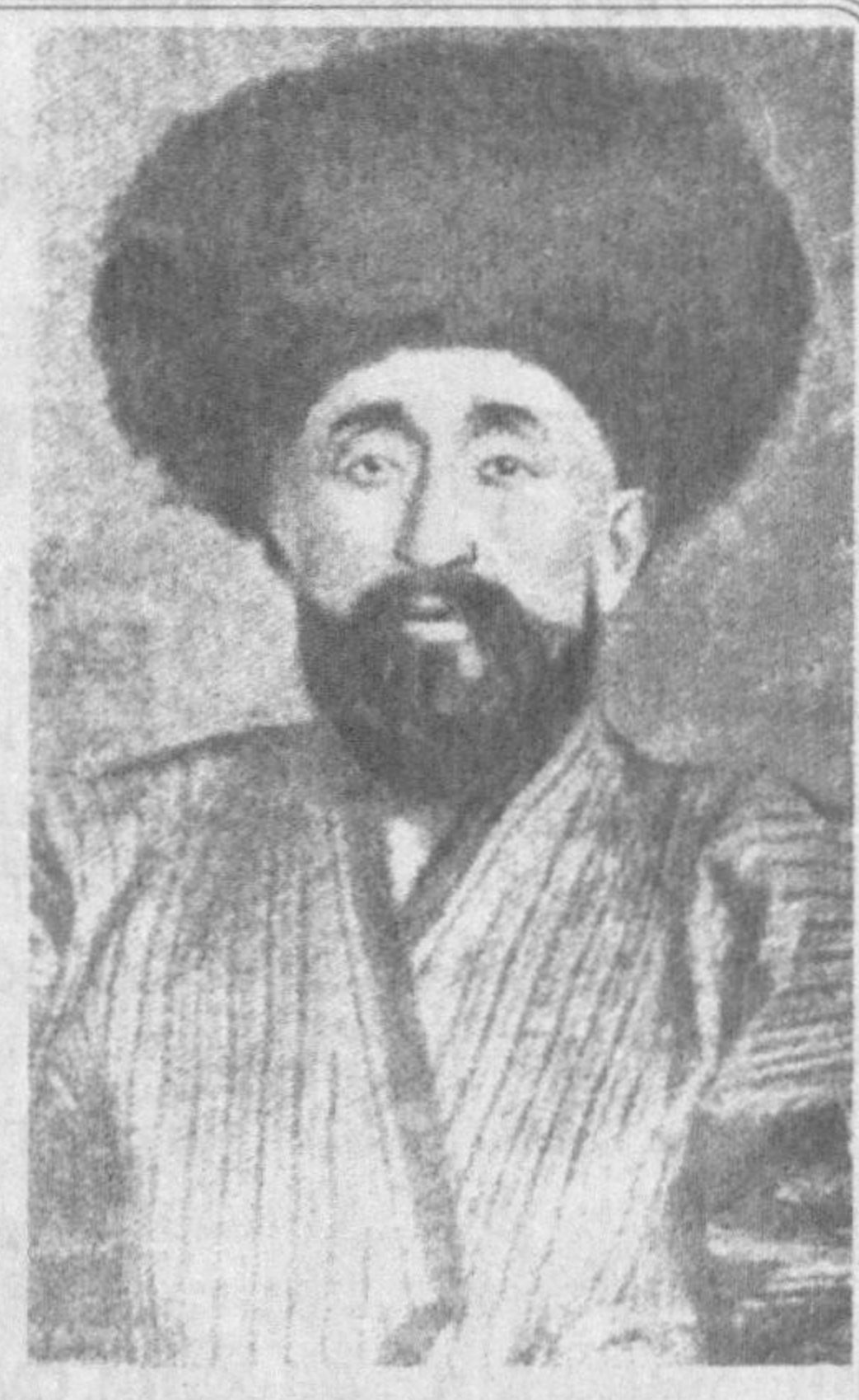
— Худойберган отанинг яна қандай ибратли ишларига «гувоҳлик» қилади бугун топилган ҳужжатлар, фото суратлар, кино кадрлар?

Тез орада ўқишга кетиб қолдим... Бир мунча вақт ўтиб мақоламни журнал саҳифасида ўқидим. Унда ўзимнинг эмас, муҳаррирнинг сўзлари ёзилган эди. Энди мустақиллик тўғрисида янги маълумотлар олиш имкони туғилганида, бизга зарур бўлган ҳужжатлар топилганида 60-йилларда ҳақ гапни айтганимга яна ишонч ҳосил қилдим. Чунончи, рус кинематографияси 1908 йилдан махсусот бера бошлаган. Девонов эса 1900 йилдаёқ ўз ижодини бошлаганини тасдиқловчи ҳужжатлар мавжуд. Бинобарин, ўзбек оператори Париждан ака-ука Люмьерлар (кино ихтирочилари) Туркистонга юборган «синематографчилар»дан тасма, аппарат сотиб олган (Худойберганнинг отаси хон саройида ишлаган, демак, моддий жиҳатдан таъминланган). Сотувчилар - французлардан кинокамера билан муомала қилишни ўрганган, тасма, химикатлар олган. Бу ўринда мен рус кино санъаткорларининг 30-40 йиллардаги хизматларига соя ташлашни истамас эдим. Уларнинг айримлари юртимизга меҳр қўйган, маданиятимизни ўрганган ва «Насриддин Бухорода», «Тоҳир ва Зухра», «Насриддин саргузаштлари», «Алишер Навоий» каби дурдона асарларни яратишда режиссёр, шеър муаллиф, оператор, актёр сифатида ибратли ишлар ҳам қилганлар, айни бир вақтда улар ўзбек ҳамкасбларидан ижрочилик санъати, шарқ маданияти сирларини ҳам ўрганганлари маълум.