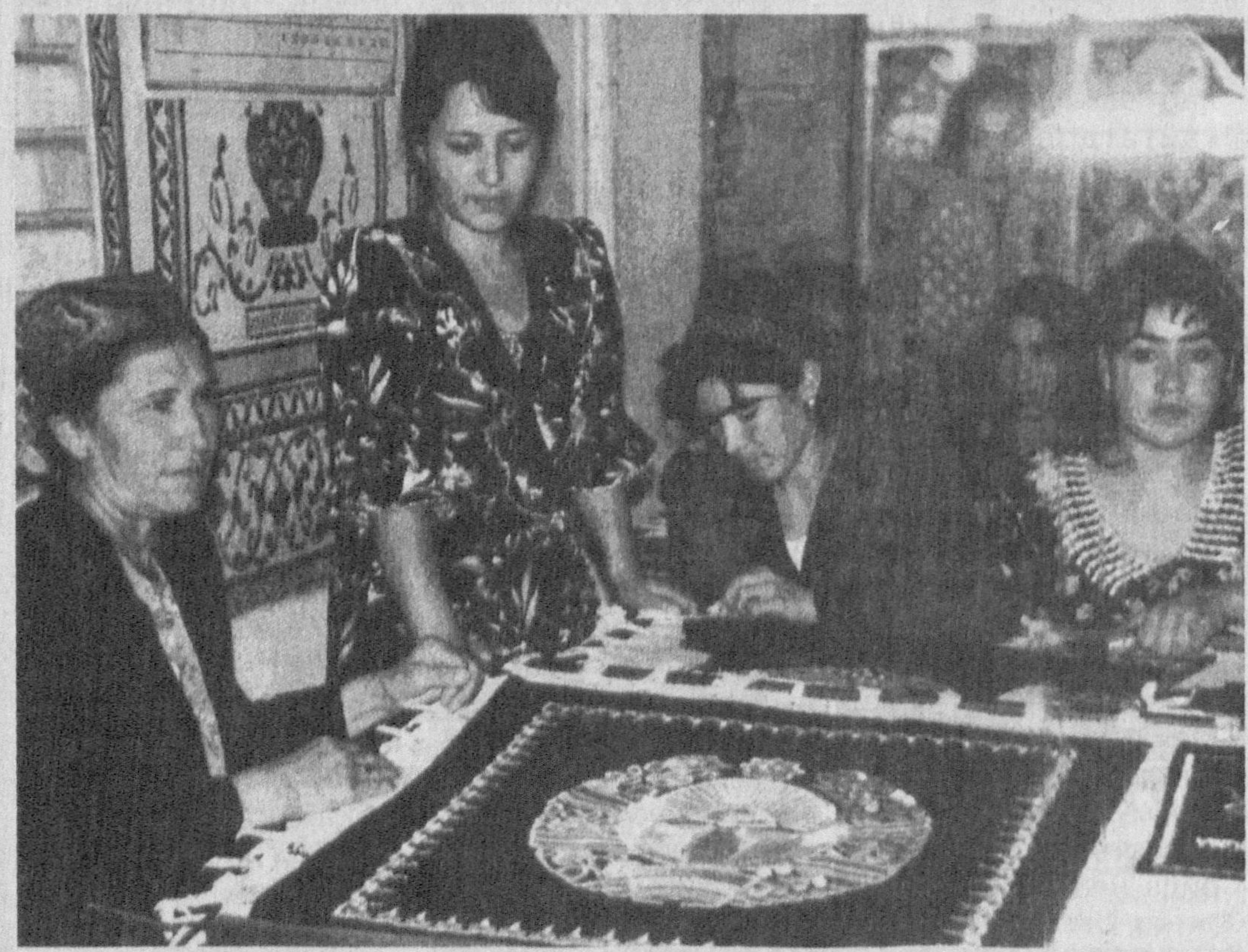
Мулқдорлар синфининг истиқболли вакиллари

«Табиат саховати», «Саттор Ибрагимов» деҳқон хўжаликлари кичик майдонлардан юқори ҳосил олишда бошқаларга ўрнак кўрсатдилар. Очигини айтганда, фермерлик иши ҳали шу куннинг талаблари даражасида ташкил этилган, деб бўлмайди. Табиийки, ўзимизга боғлиқ бўлмаган муаммолар ҳам йўқ эмас. Айниқса, фермер хўжалигининг эмга бўлган талабини қондириш қончарқисиз аҳволда. Биргина мисол: ўтган йили Косон ёғ-мойни қайта ишлаш заводидан уюшма фонди буйича 40 тонна ем, 40 тонна шулка олиш белгиланган эди. Лекин завод фонд йўқлигини рўқач қилиб талабни рад қилди. Хуллас, йил давомида уюшма томонидан фермерларга бор-йўғи 15 тонна ем тарқатилди, холос. Аслида бу ем билан ҳатто бизнинг фермер хўжалигимизнинг эҳтиёжини ҳам қондириб бўлмайди. Шундай экан, ҳар бир фермер талаб-эҳтиёжи алоҳида эътиборга олинса дейман. Фермернинг ажратилган ёрни заводдан ўз отарига етказишда бошидан кечирадиган саргузаштлари, қийинчиликларини гапирмай ҳам қўяқолай, «Айтсам тилим — айтмасам қилим қуяди», дегани шу бўлса керак-да. Уюшма қошида фермерларга хизмат кўрсатувчи база, МТП ташкил этилиб, митти тракторлар билан хизмат кўрсатиш йўлга қўйилса, айна мудоа бўларди.