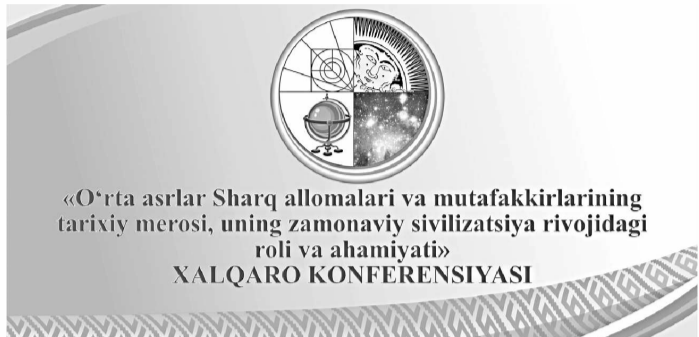
«O' rta asrlar Sharq allomalari va mutafakkirlarining tarixiy merosi, uning zamonaviy sivilizatsiya rivojidadagi roli va ahamiyati» XALQARO KONFERENSIYASI

— Ўзбекистон асрлар давомида илм-фан, таълим-тарбия ва маданият маркази бўлиб келгани баробарида жаҳон цивилизацияси таракқиётига самолқли ҳисса қўшган. Жумладан, XIV-XV асрларда буюк астроном ва математик Мирзо Улуғбек шу заминда яшаган ва илмий фаолият билан шуғулланган. Унинг асарлари ва астрономияга оид жадвалларидан