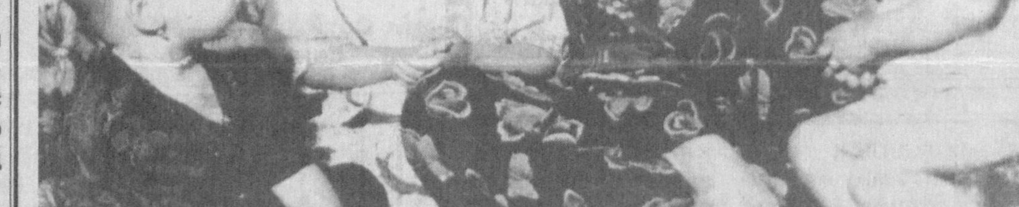
ИИВ Матбуот маркази хабар қилади

Учрашувда футбол мух- лисларига яхши таниш бўлган Павел Садирининг ҳозир бўлиши ҳам ўзига жак Осиё биринчилиги Ўзбекистон футболли шон- шухратининг ўзига ҳос намойишига айланса! Ҳар ҳолда мухлислар умид қилишга ҳақидирлар. Ўн иккинчи турнинг қол- ган учрашувларида қуйи- даги натижалар қайд этилди: «Хоразм» — «Не- фти» — 1:1, «Насаф» — «Бухоро» — 3:0, «Сурхон» — «Қизилқум» — 2:1, «Ме- таллург» — «Самарқанд -Динамо» — 1:0, «Сўғдиёна» — «Навбахор» — 1:1. Навбатдаги тур учра- шувлари 21 майда бўлиб ўтади. Шу кун чемпионат пешқадами «Дўстлик» ўз майдонидан аутсайдер «Ту- рон» жамоасини қабул қилади. Турнир жадалли- нинг иккинчи поғонасида бораётган «Насаф» эса қаторасига тўрт учрашув- ни сафарда ўтказди. Кўрамиз, у ўз мавқени сақлаб қола олармикан?