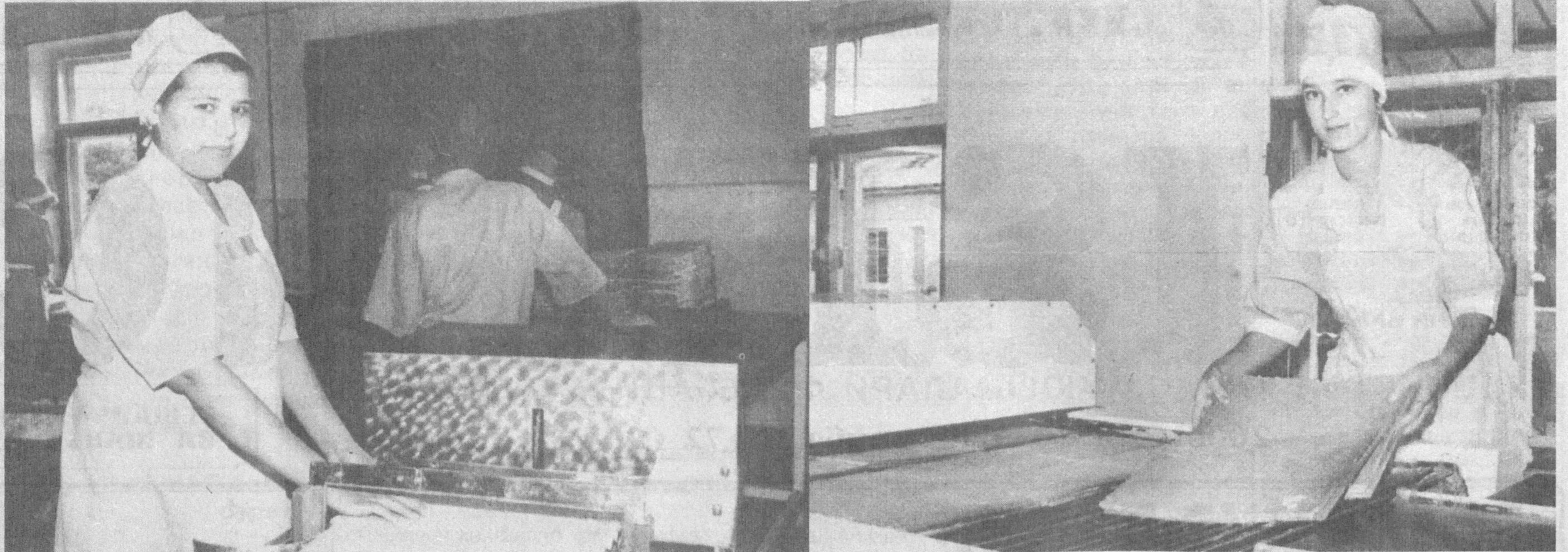
Янгийулдаги Ўзбекистон-Болгария қўшма корхонасида сўнгги ойларда янги иш ўринлари яратилди. Энг замонавий технология асосида махсулот тайёрлаётган малакали ходимлар сифатга алоҳида эътибор беришмоқда. Айни кунларда қўшма