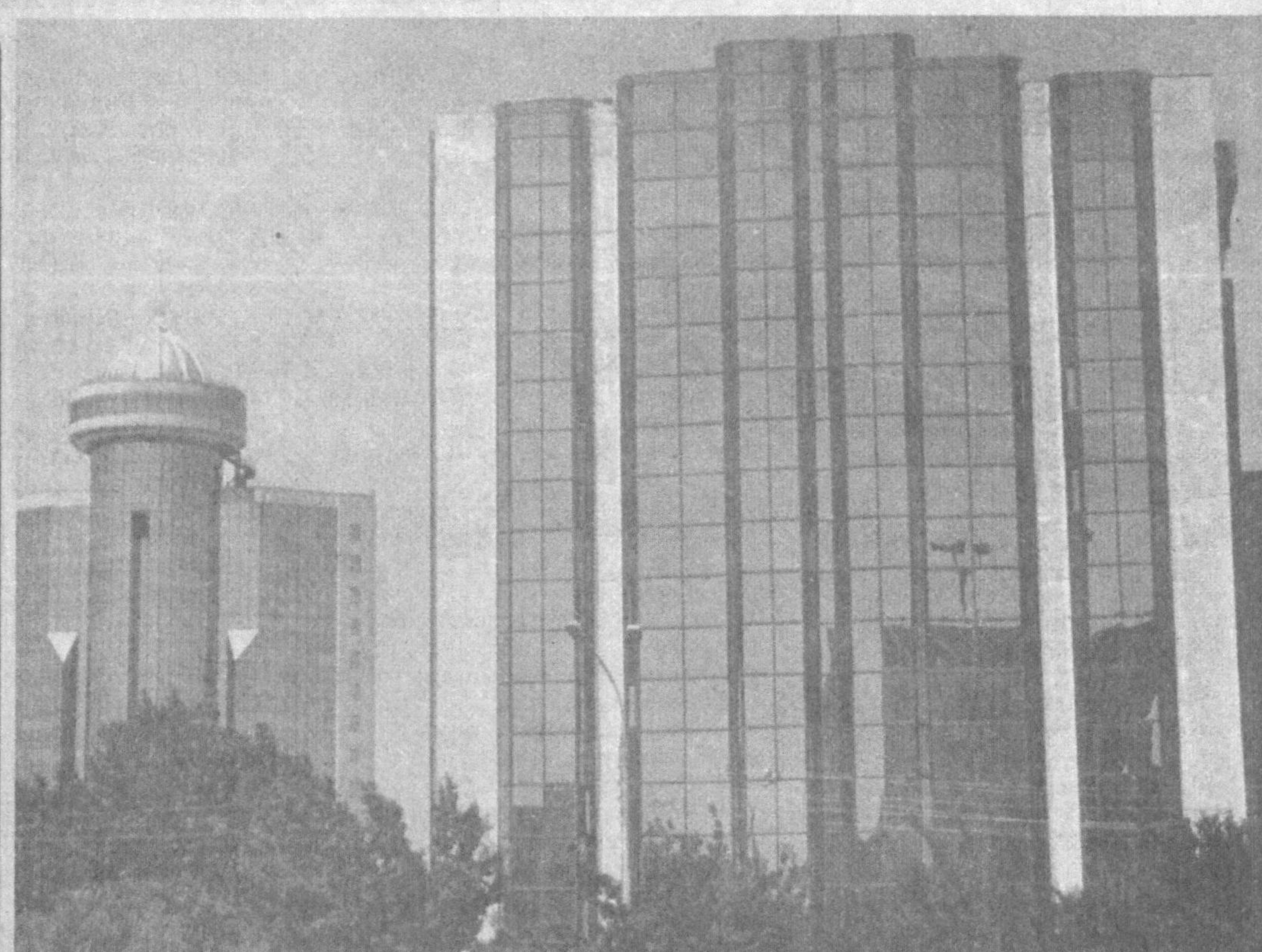
Пойтахт чирой очмоқда.