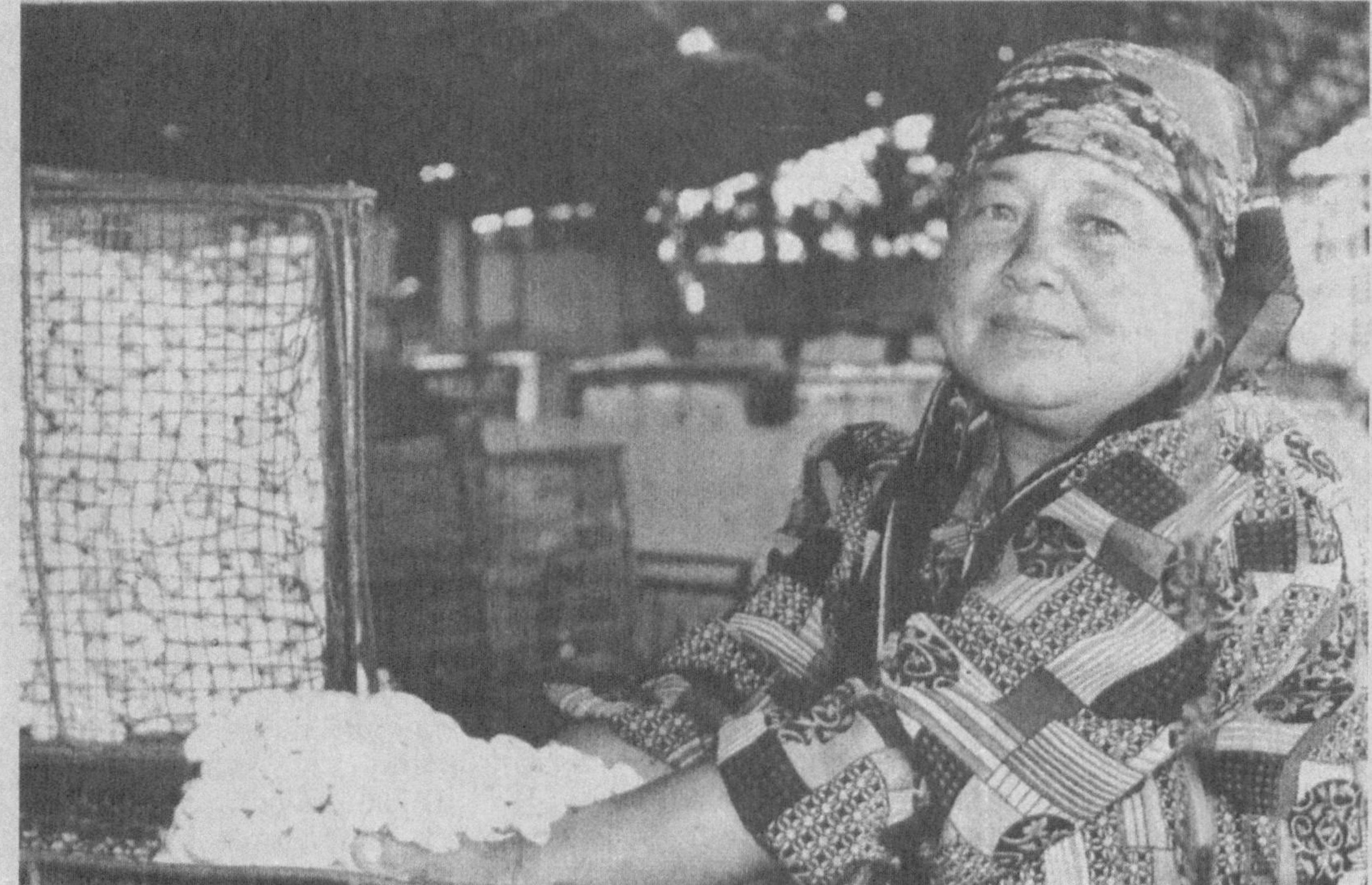
Бўка туманидаги «Бахмал» ширкат ҳўжалиги қумуш тола иждоқорлари 3610 килограмм сифатли пилла топшириб, режани удалашди. Ҳўжалик аъзолари яна 200 килограмм қимматли хом-ашё етказиб беришга аҳд қилдилар.

Кегейли туманида чет эл сармояси ҳисобига қўшма корхоналар барпо этиш бўйича муҳим ишлар бажарилмоқда. Жумладан, Бельгиянинг «Велекс» фирмаси билан «Халқобод момиги» ҳиссдорлик жамияти ўртасида пахта чиқитидан брезент тайёрлайдиган қўшма корхона куриш бўйича шартнома имзоланди. Бу ерда йилга 50 миң квадрат метр брезент ишлаб чиқарилади. Шунингдек, Украинанин «Карамаш» ҳиссдорлик жамияти билан «Парахат» саноат савдо корхонаси ҳамкорликда керамика махсуотлари ишлаб чиқарадиган янги корхона барпо этмоқда.