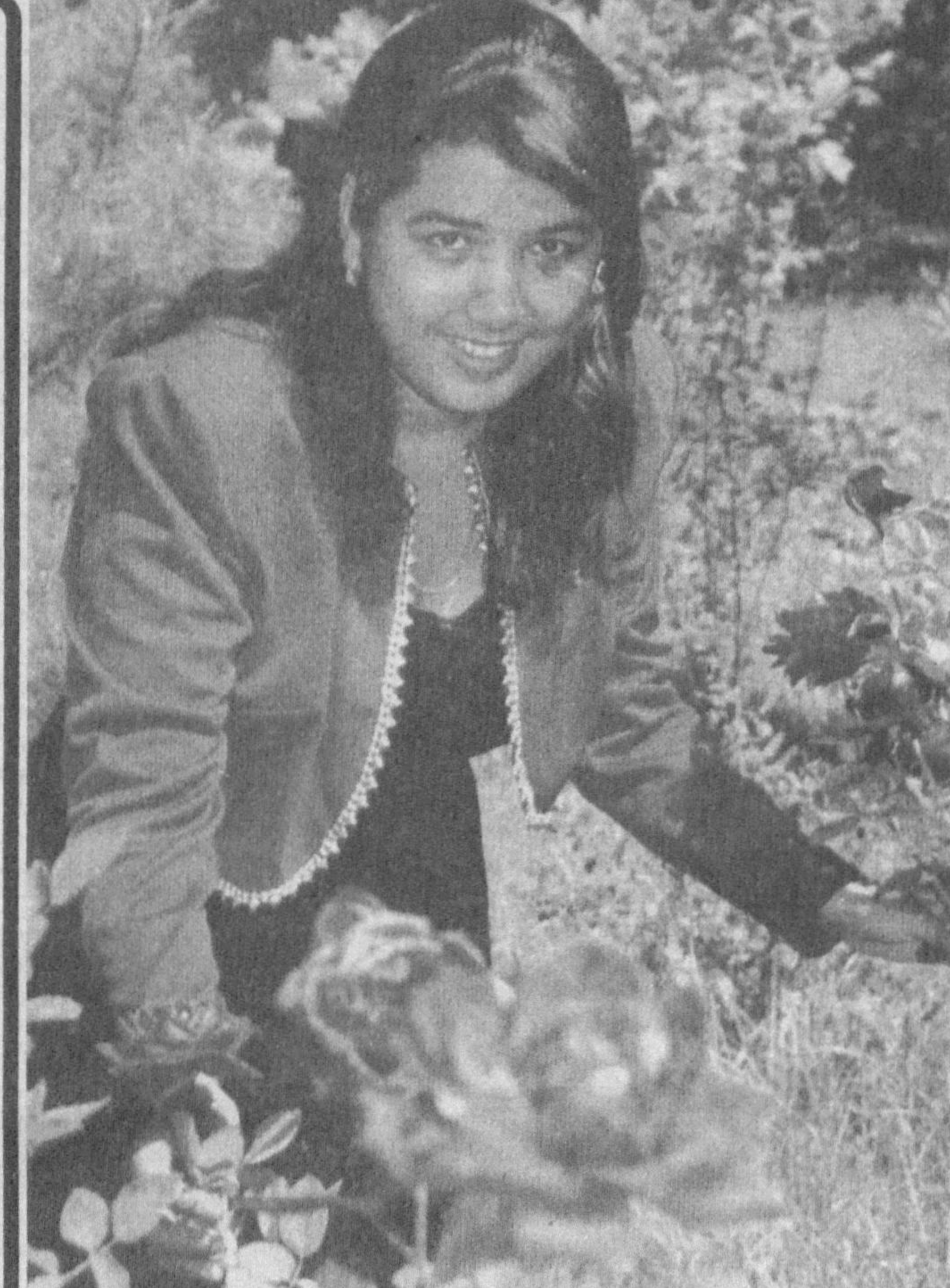
Боғ гулига ҳамроҳмисан, Боғдагул? Туйғуларин жилволломай доғда гул. Соҳирлигинг сеҳргарни ўлдирад — Мен нетайин: ожизликдан куйди дил.