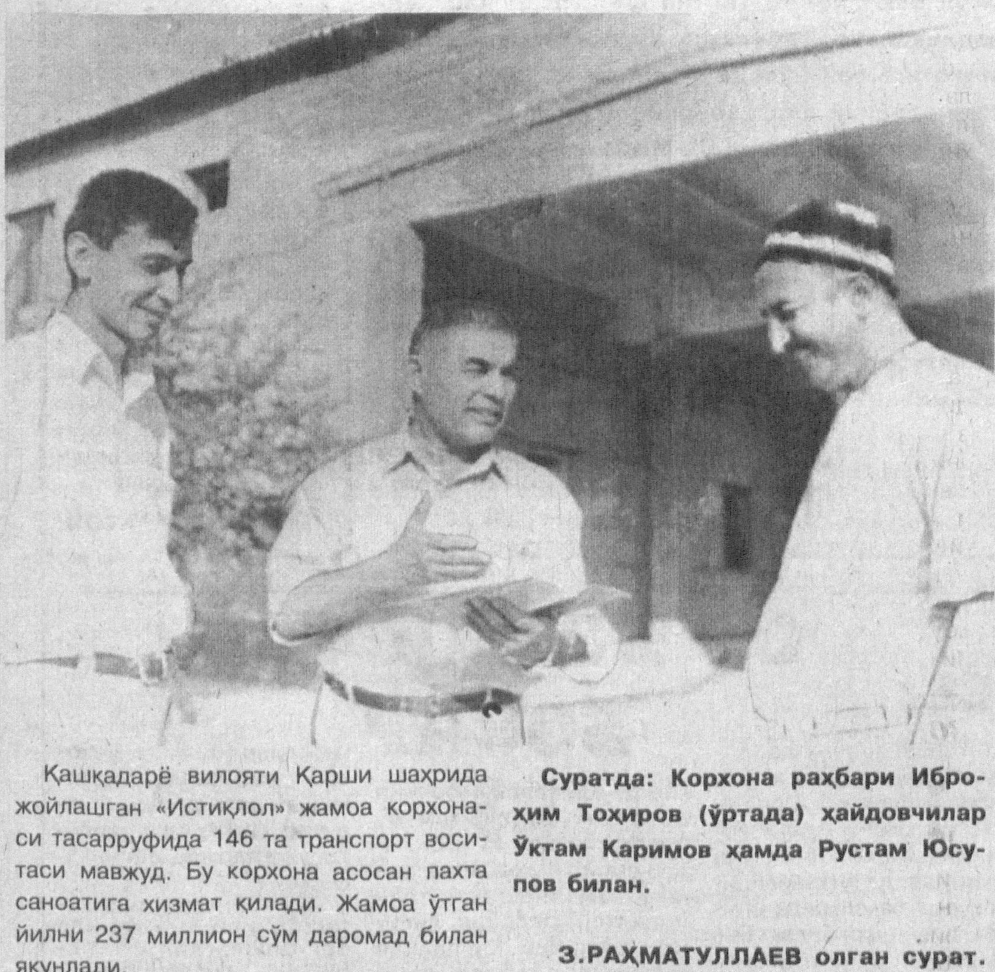
Қашқадарё вилояти Қарши шаҳрида жойлашган «Истиклол» жамоа қорхона-си тасарруфидида 146 та транспорт воси-таси мавжуд. Бу қорхона асосан пахта санаотида хизмат қилади. Жамоа ўтган йилни 237 миллион сўм даромад билан якунлади.

Суҳбатдош: Ялғош САРИЕВ, «Ишонч» мухбири.