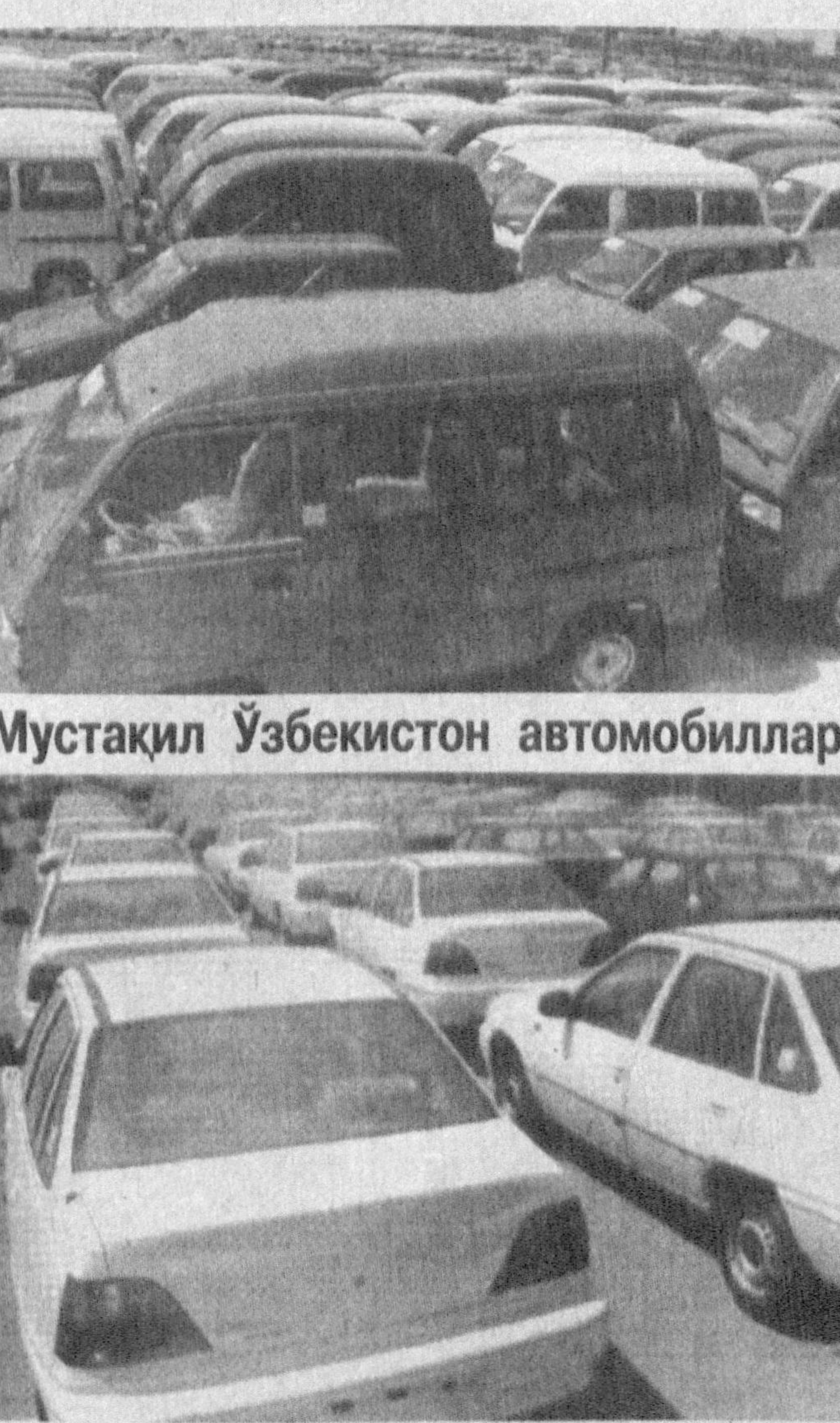
Мустақил Ўзбекистон автомобиллари