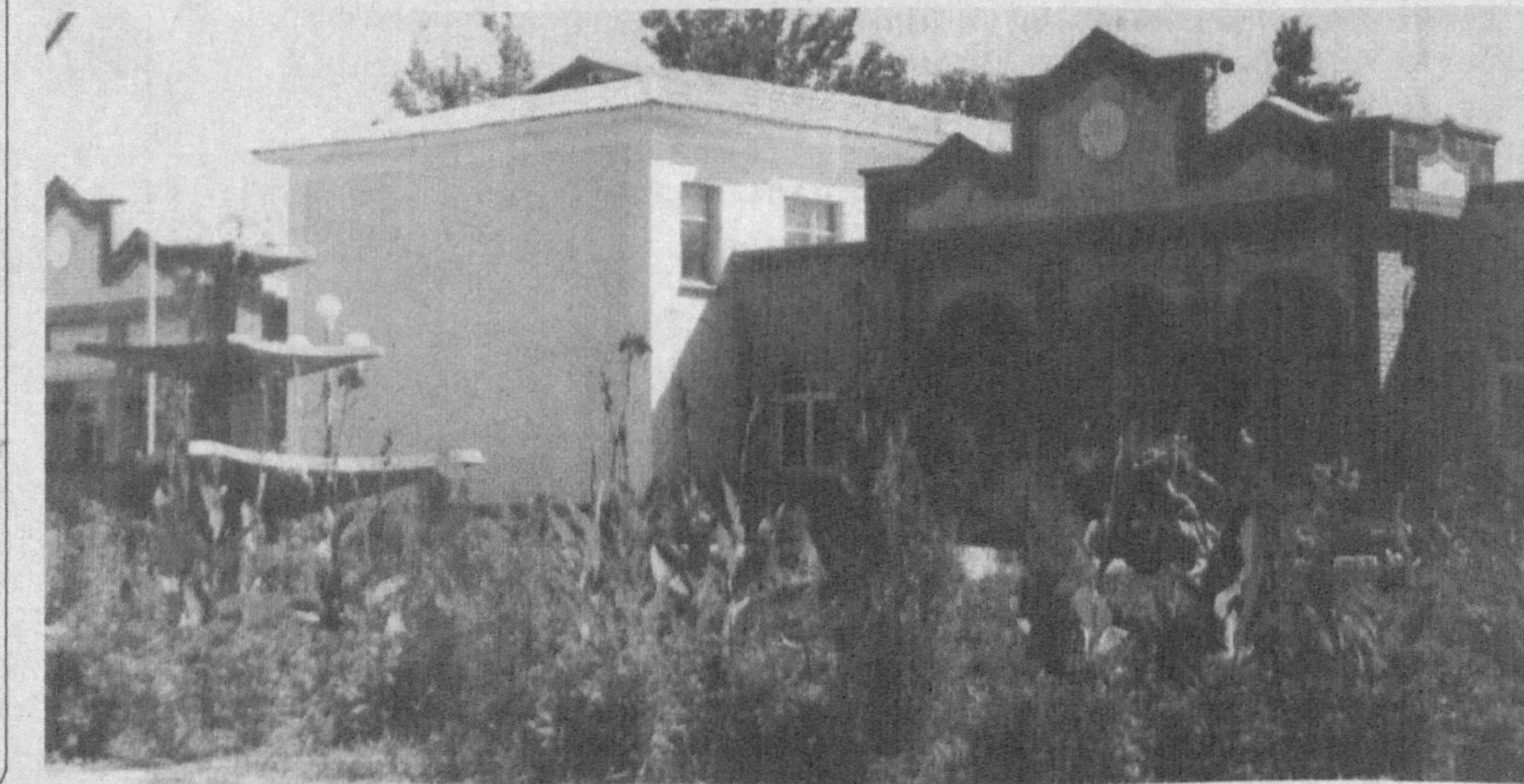
Р.ҚУРБОНОВ, «Ишонч» муҳбири