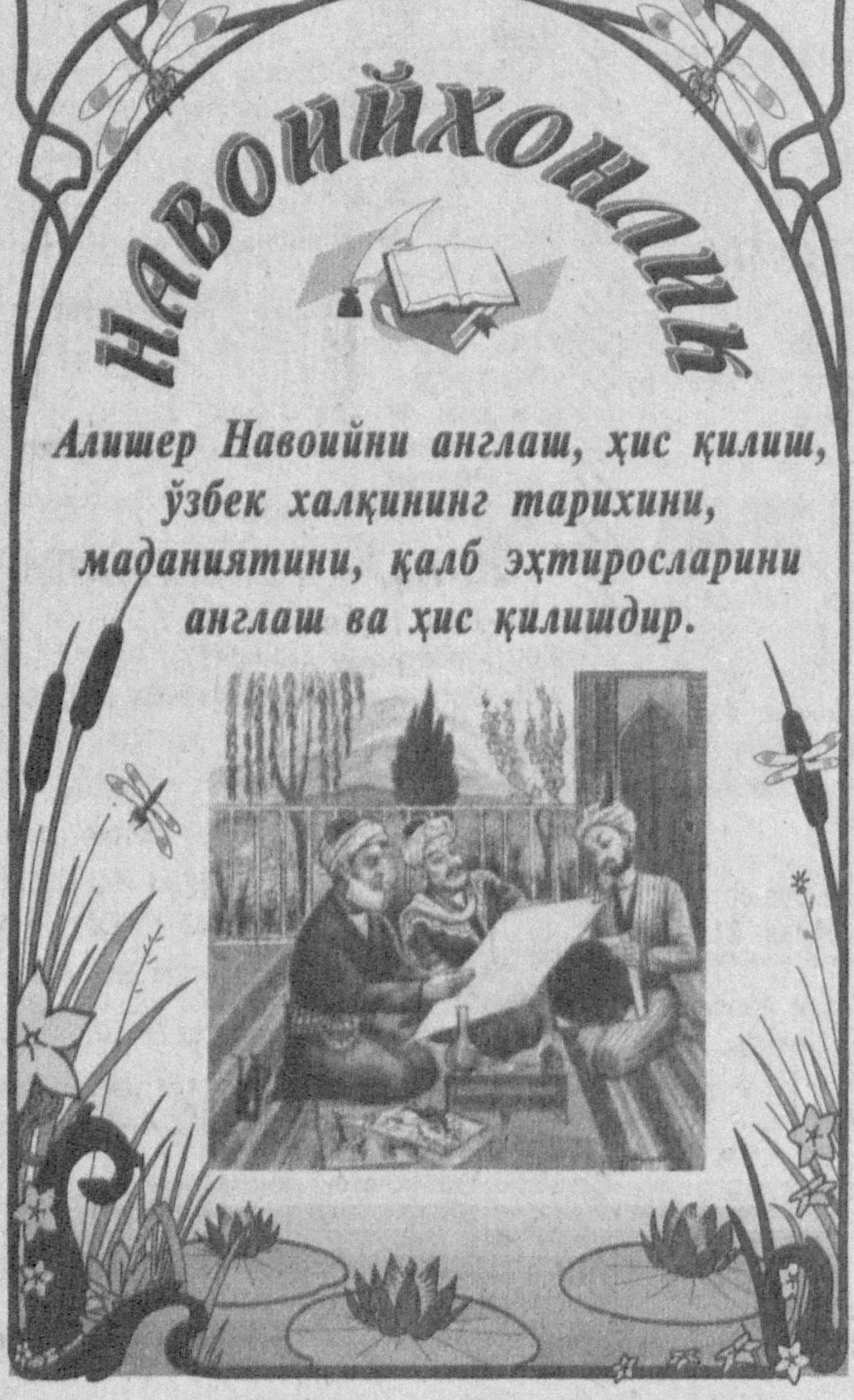
Алишер Навоийни англаш, ҳис қилиш, ўзбек халқининг тарихини, маданиятини, қалб эҳтиросларини англаш ва ҳис қилишдир.

Маълумки, севги ва муҳаббат дейилганда кўнгли бериш, бир инсоннинг иккинчи бир инсонга кўнглидан боғланиши тушунилади. Ишқ эса жондан севиш, ўзни унутиб ёр ҳавлига берилиш маъносига эга. Тасаввуфда Ҳақнинг зуҳурига сабаб бўладиган илк сифатга ишқ дейилган. Бу ишқнинг номи - ҳақиқий ишқ. Лекин инсон бу йўлда (яъни ҳақиқий ишқда) тўла камолга етишиши учун аввало мажозий ишқ дейилган босқични муваффақият билан кечиби ўтиши шарт ҳисобланган.