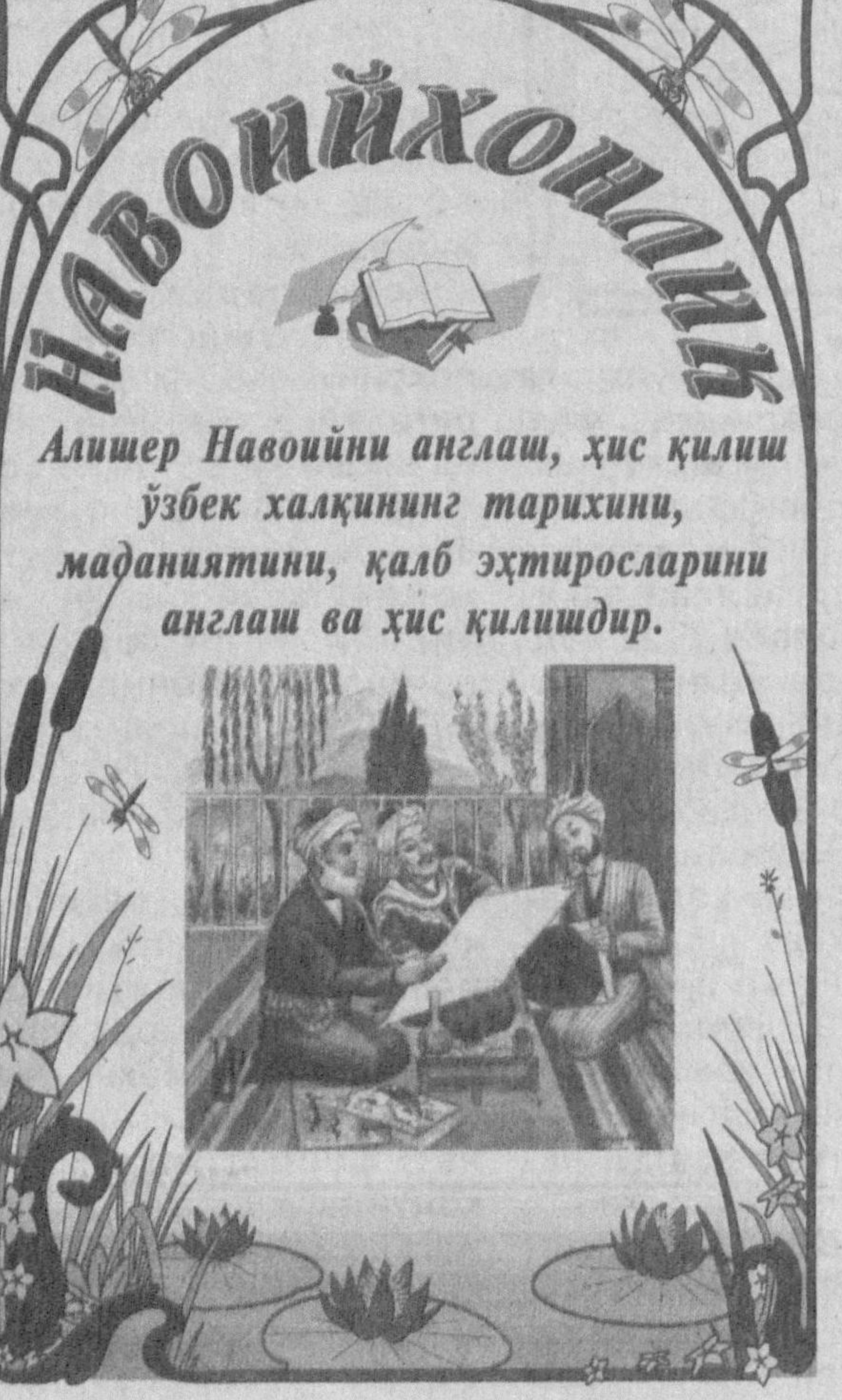
Алишер Навоийни англаш, ҳис қилиш ўзбек халқининг тарихини, маданиятини, қалб эҳтиросларини англаш ва ҳис қилишдир.

Маълумки, Исо Рухиллоҳ ўзининг нафаси билан ўликини ҳам тирилтирган. Газал қаҳрамони эса Исо дами - нафасини гўё назарга илмайди. Яъни, «Менинг ранжим шифоси учун маъшуқам қиличи захмининг қатра қони кифоя», дейди. Навбатдаги байт маъноси ҳам шунга ўхшаш: