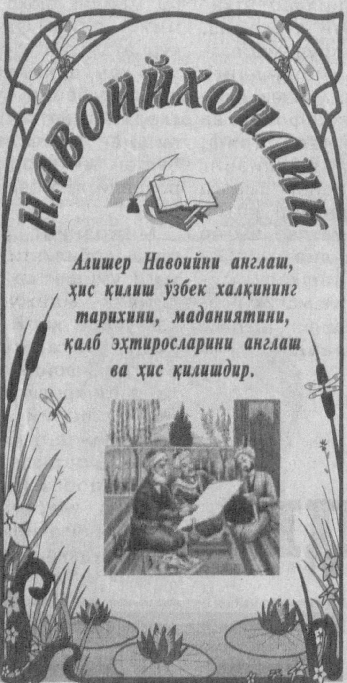
Алишер Навойини англаш, ҳис қилиш ўзбек халқининг тарихини, маданиятини, қалб эҳтиросларини англаш ва ҳис қилишдир.

«ГАР ЕТАР АГЁРДИН ЮЗ МИНГ ЖАРОҲАТ...» (Бир ғазал шарҳи)