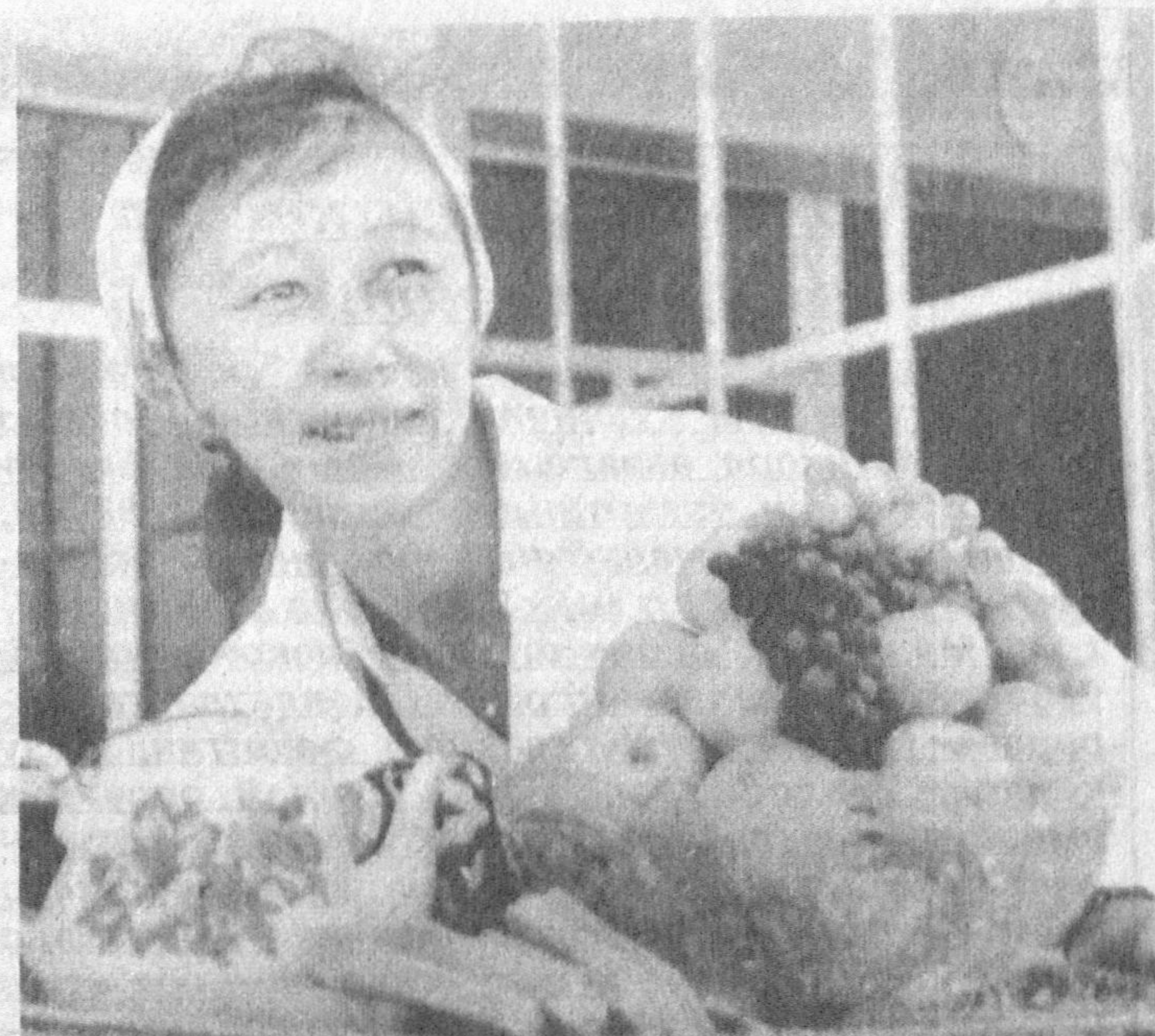
Қашқадарё вилоят кенгаши сессиясидан кейинги ўйлар

СЕШАНБА, ЧОРШАНБА, ЖУМА ВА ШАНБА КУНЛАРИ ЧИҚАДИ