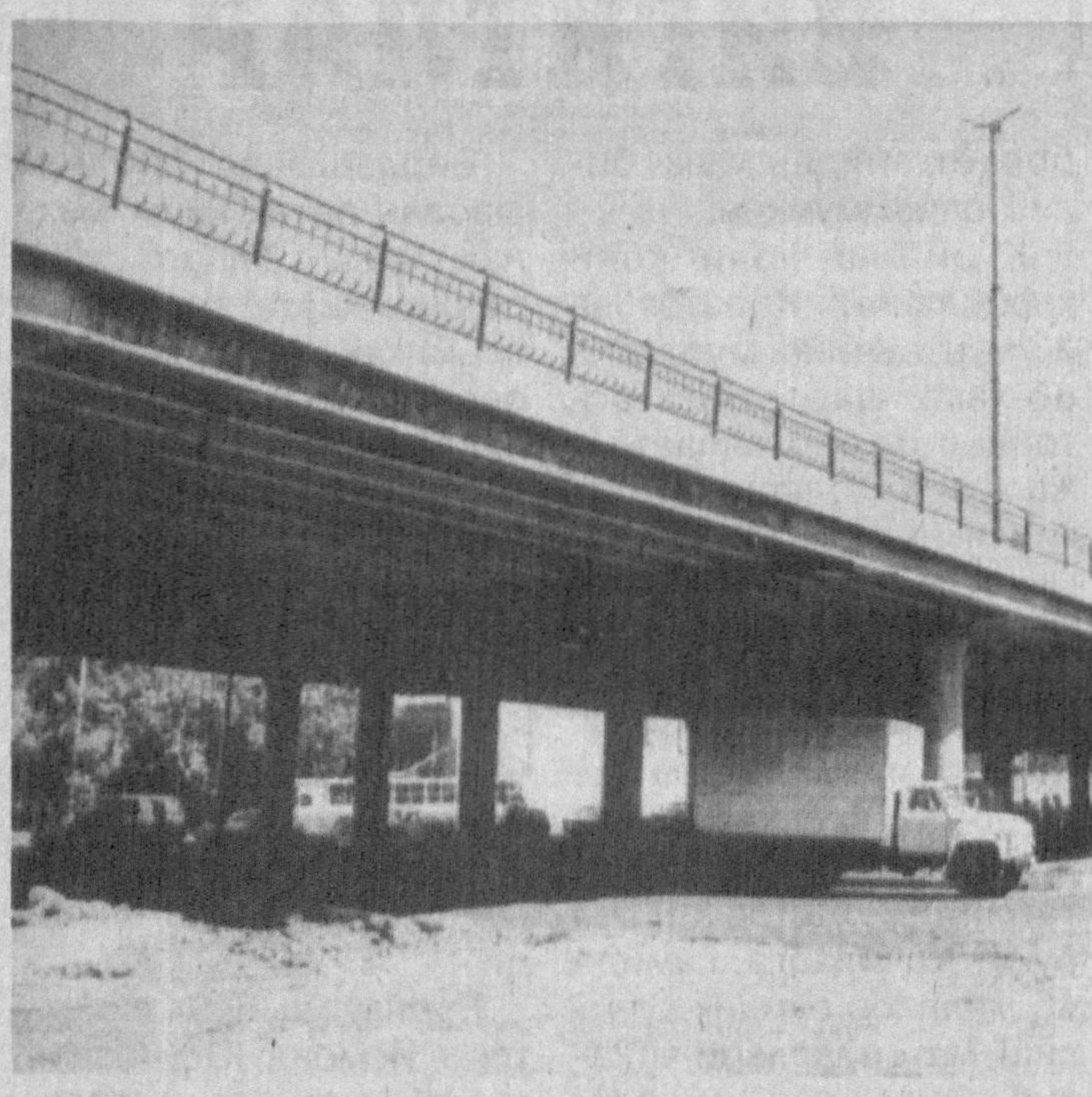
Суратда: Кўприк қурилишидан лавҳалар.