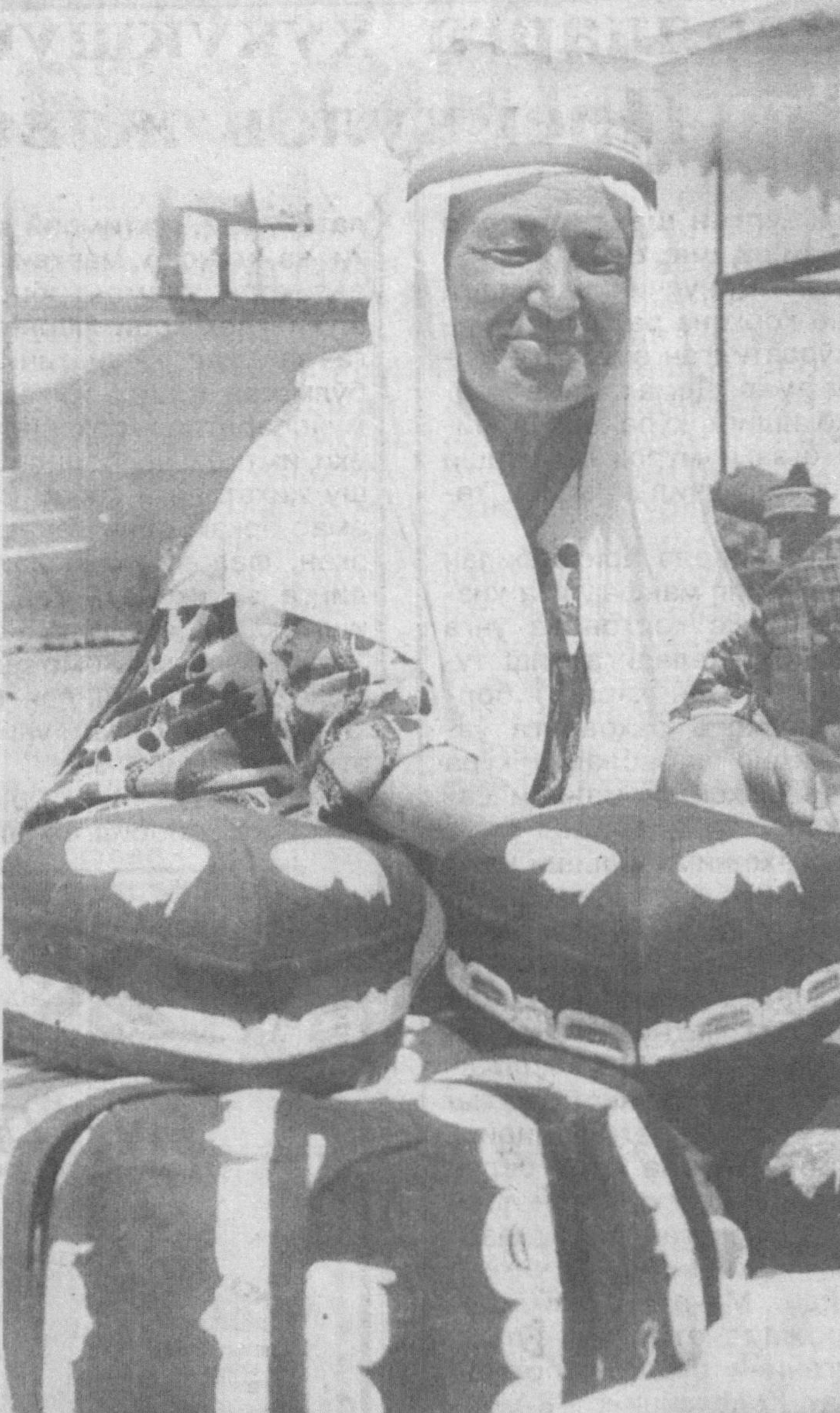
Суратда: Ургут дўппилари.

Дўппи ўзбек халқининг миллий рамзи, гурурига айланган. Дунёнинг қай бурчағида бўлманг, дўппи кийган кишини кўрсангиз «Ўзимизнинг ўзбек» деб дилингиз ёришади.