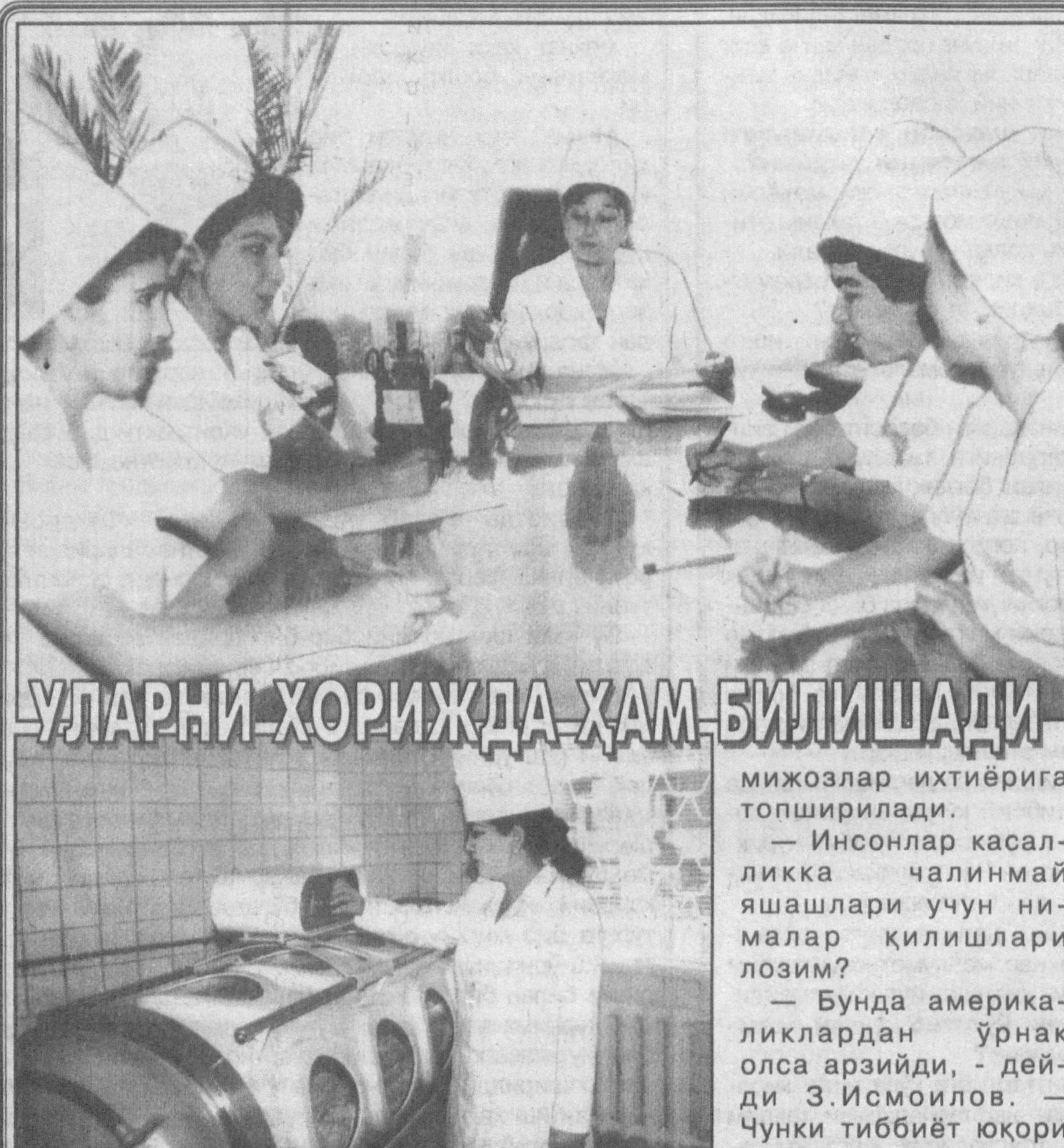
УЛАРНИ ХОРИЖДА ҲАМ БИЛИШАДИ

Шу тариқа улуг ватандошимизнинг асарлари бутун дунёга тарқала бошлади. «Қонуннинг айрим қисмлари форс, урду, турк, инглиз, немис ва француз тилларига таржима қилинди. Ўзбек шарқшунослари самарали изланишлари билан Ибн Синонинг бу шоҳ асарининг бешта китоби 1954-1961 йилларда Тошкентда нашр этилди.