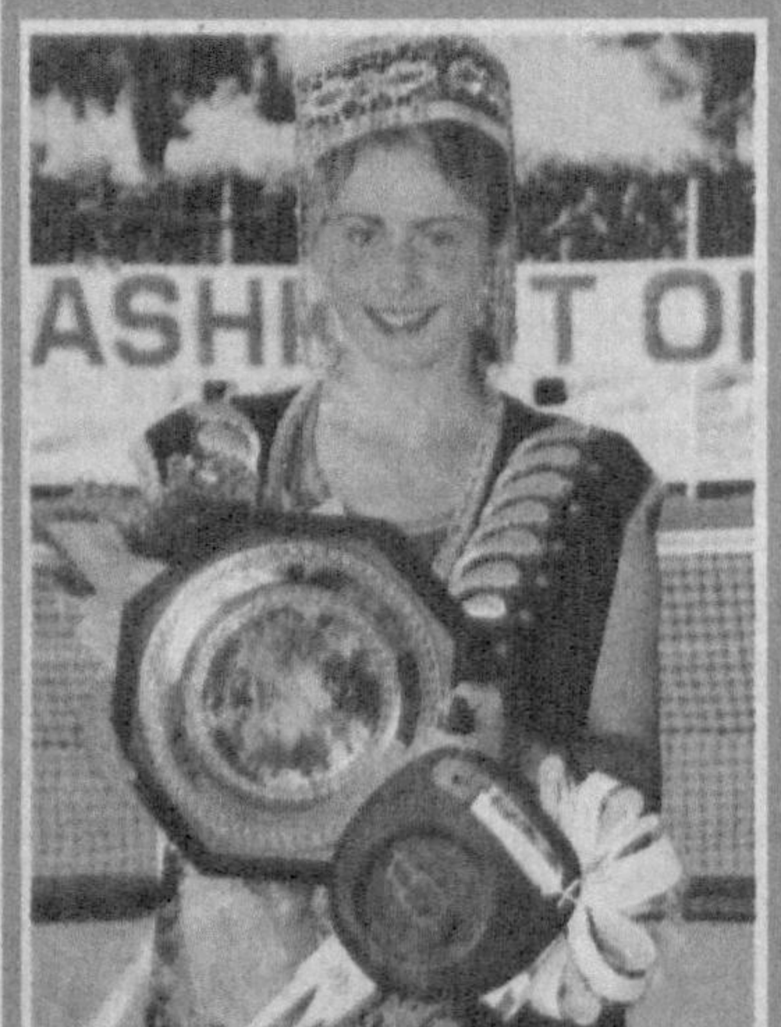
Республика Олимпия захиралари спорт коллежи кортларида Хотин-қизлар теннис уюшмаси (WTA) мусобақалари тақвимига кирувчи аъёнаний тарзда ўтказиб келинаётган «Тошкент опен — 2011» халқаро турнири ўз якунига етди.

Нуфузли мусобақанинг яққалик беллашуварларида Ксения Первак (Россия) голиб чиқди. Биринчи рақамда сараланган россиялик моҳир теннисчи хал қилувчи финал беллашувида чехиялик Ева Бирнерова устидан 6:3, 6:1 ҳисобида зафар кучиб, бош соврин соҳибасига айланди. «Тошкент опен — 2011» халқаро турнирининг жуфтликлар мусобақасида галаба грециялик Елени Данилидоу ва россиялик Виталия Дятченко дуэтига насиб қилди. Турнирда мағлубиятсиз уйнаган мазкур жуфтлик финал баҳсида украиналик оилавий дуэт — Надия ва Людмила Киченюкларни 6:4, 6:3 ҳисобида енди.