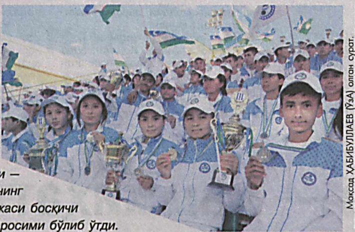
Нукусда "Умид ниҳоллари — 2018" спорт мусобақаларининг Қорақалпоғистон Республикаси босқичи голибларини тақдирлаш маросими бўлиб ўтди.