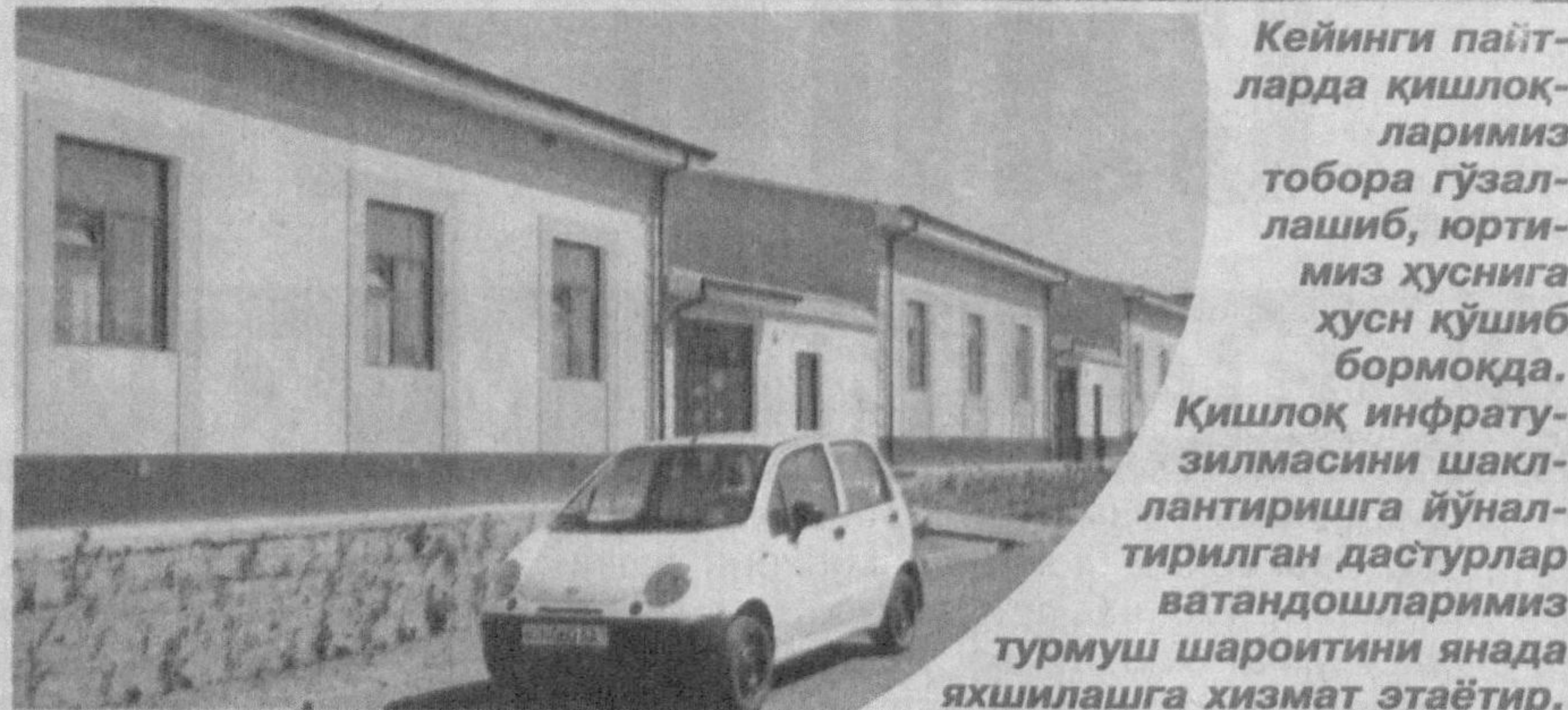
Кейинги пайтларда қишлоқларимиз тобора гўзаллашиб, юртимиз ҳуснига хусн қўшиб бормоқда. Қишлоқ инфратузилмасини шакллантиришга йўналтирилган дастурлар ватандошларимиз турмуш шароитини янада яхшилашга хизмат этаётир.

Хусусан, Андижон туманидаги «Уриқзор» МФЙ аҳолиси ақиндагина замонавий турар-жойларга эга бўлишди. Лойиҳа қиймати 7 млрд. 22 млн. сўмни ташкил этувчи мазкур бунёдкорлик ишлари натижасида 82 оила замонавий уй-жойга кўчиб ўтди. Тезкор, аммо пухталик билан амалга оширилган жараёнда «Камолот ишонч Анд» хусусий корхонаси, «Холис» ва «Им-кон қурилиш савдо» МЧЖнинг 700 нафарга яқин қурувчи ва малакали мутахассислари иштирок этишди.