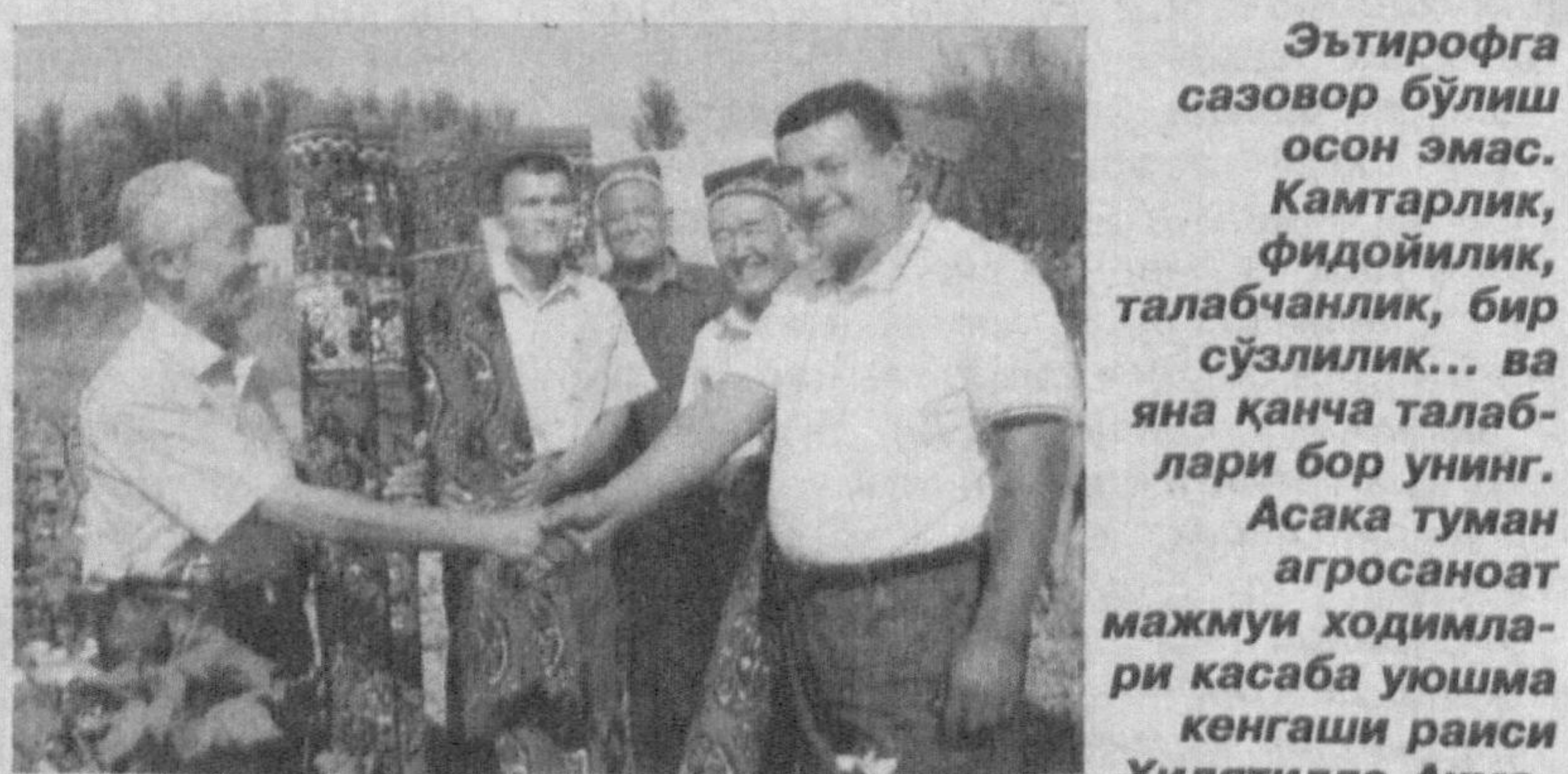
«Эҳтиром» нишонлари билан тақдирланганини эшитганимда ана шу фикрлар хаёлимдан ўтди.