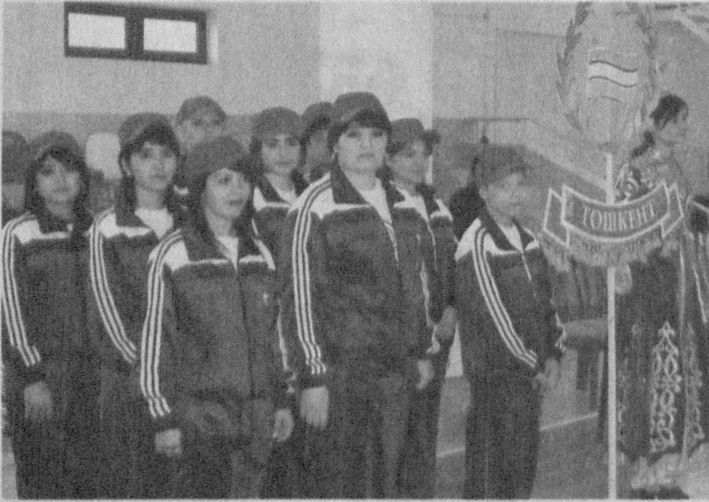
(Давоми. Боши 1-бетда) Касаба уюшма спортга бир назар

Федерация томонидан ишчи-ходимларнинг ижтимоий-иқтисодий, ҳуқуқий манфаатларини ҳимоялаш билан бирга, улар ва оила аъзоларини jismoniy тарбия ва спортга кенг жалб этиш борасида тизимли ва кенг қамровли ишлар йўлга қўйилган.