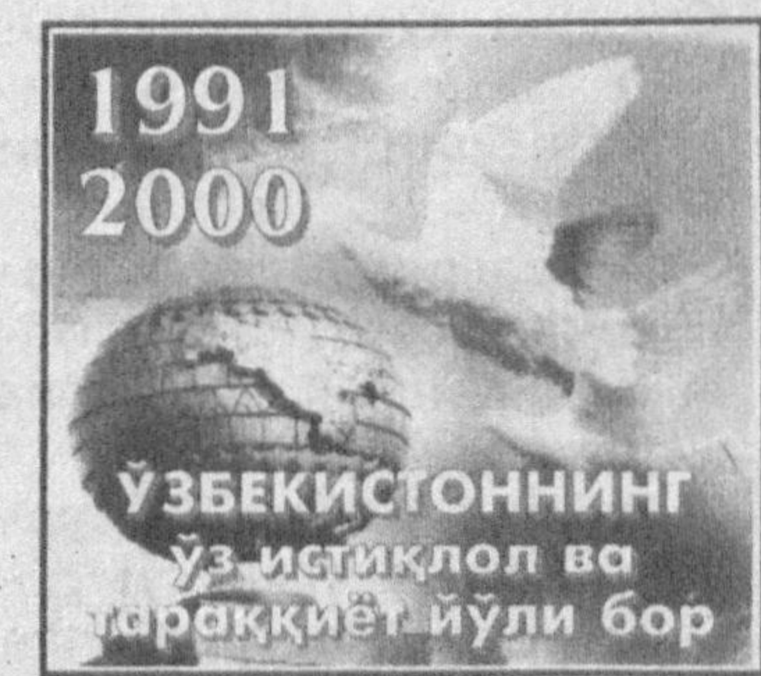
1991-2000 ЎЗБЕКИСТОННИНГ ЎЗ ИСТИҚЛОЛ ВА ТАРАҚҚИЁТ ЙЎЛИ БОР

Жиззах вилояти ҳокимлиги ва ижтимоий таъминот бошқармаси ташаббуси билан Ўзбекистон мустақиллигининг 9 йиллиги байрами шарафига 55 нафар ногирон болаларга вилоят ҳокими Ш.Мирзиёев ногиронлар арава-чаларини топширди. Тадбирга вилоят санъаткорлари, кўғирчоқ театри ижодкорлари ўз чиқишлари билан файз киритди.