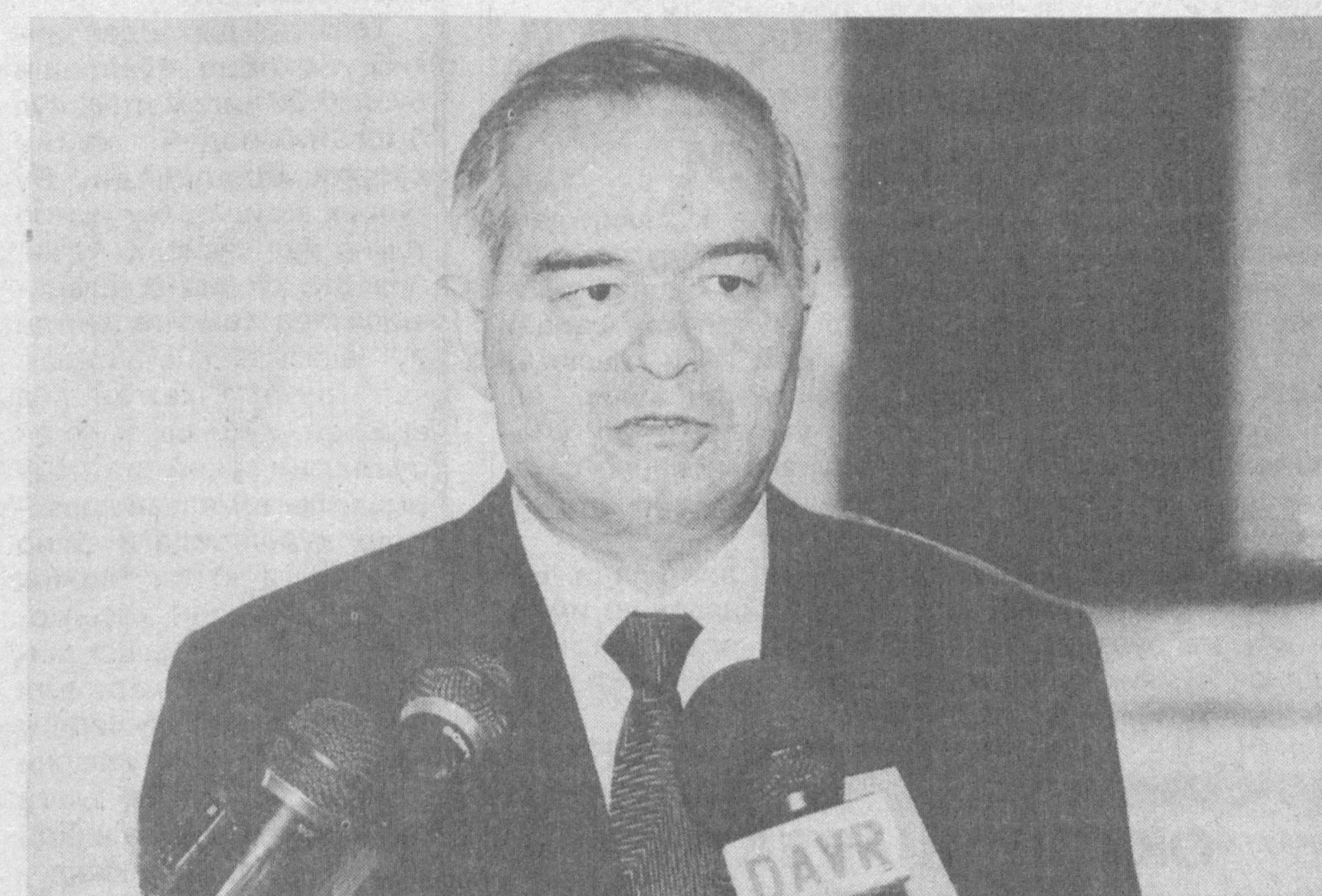
Ўзбекистон Республикаси Президенти Ислам Каримов

Нью-Йоркда бошланган «БМТнинг мингйиллик саммити» ушбу нуфузли ташкилотнинг 20-аср сўнггидаги энг йirik анжуманидир. Унда 150 дан ортиқ мамлакатнинг давлат ва ҳукумат бошлиқлари иштирок этмоқда. Янги мингйиллик арафасида дунёвий муаммоларни муҳокама этиш учун ўзига хос ва жуда қулай шароит юзага келди. «Мингйиллик саммити»да дунёнинг деярли барча мамлақати раҳбарлари иштирок этаётгани эса ушбу шароитдан фойдаланиш учун ноёб имконият яратмоқда. Ўзбекистон Президенти ҳам БМТ Бош қотиби Кофи Аннанинг мазкур анжуманда қатнашиш тўғрисида йўллаган таклифини қабул қилди.