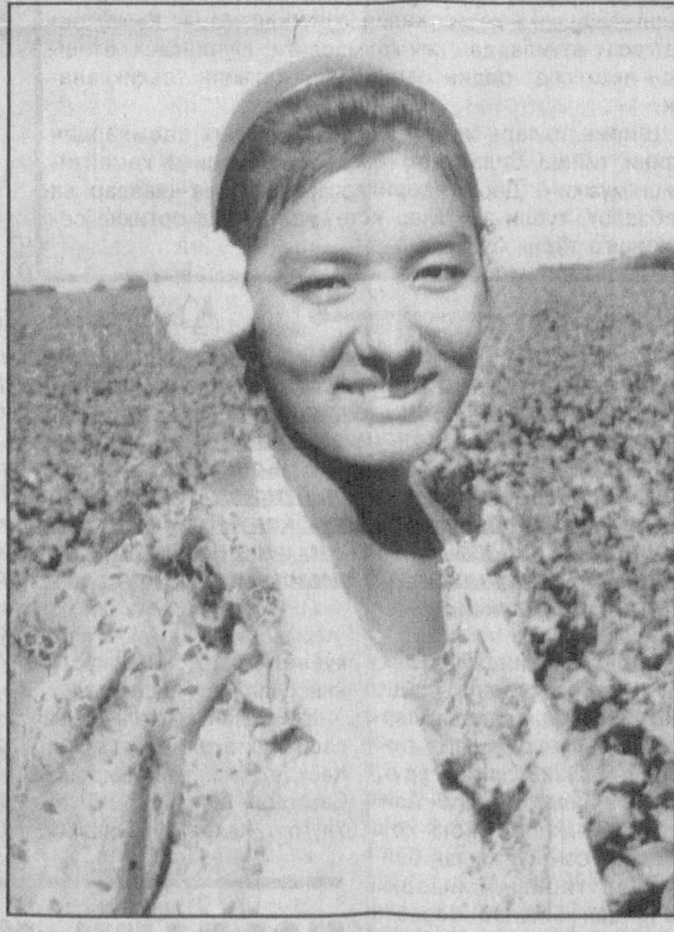
Миршкор эрта баҳордан орзиқиб кутган дамлар бошланди. Чамандек очилган пахтазорларда ҳосил йғим-терими кун сайин авж олмоқда. Чевар теримчилар дастлабки тонналарни этаклардан тўкиб мамлакатимиз оқ ол-

Саволларингизга жавобан айтишимиз мумкин. Сиз томонлар ўртасида тузилган шартномага асосан фақат кўрсатилган хизмат ҳақи тўлаб борасиз. Телефондан фойдаланганлик учун маълум мuddатда ҳақини тўламаганлик учун телефонни батамом узишга йўл қўйилмайди. Алоқа хизмати ҳодимларининг Сиздан телефон ўрнатиш учун яна 5000 сўм, шунингдек, 350 метр сим талаб қилишлари нотўғри.