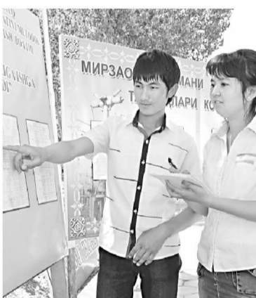
Тадбир давомида мутасаддилар журналистларни қизиқтарган саволларга атрафчилик жавоб қайтарди.

Иш билан банд бўлмаган фуқаролар учун корхона ва ташкилотлардаги мавжуд бўш иш ўринлари тўғрисидаги маълумотлар Меҳнат ва аҳолини ижтимоий муҳофаза қилиш вазирлиги, Тошкент шаҳар ҳокимлигининг расмий веб-сайтларида доимий жойлаштириб берилмоқда.